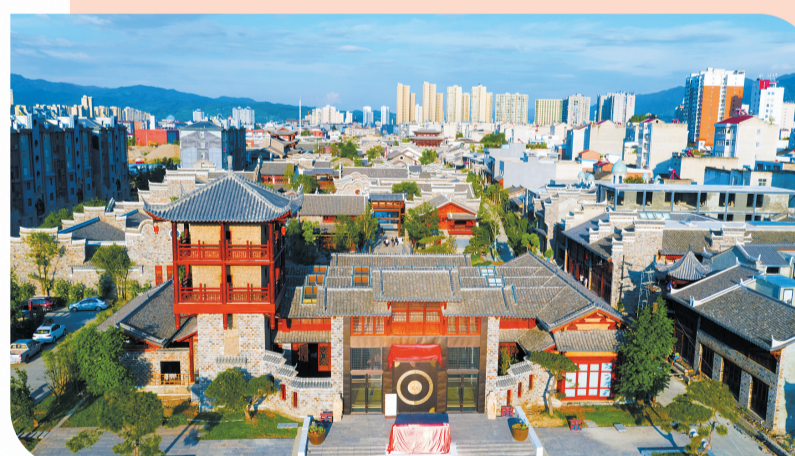
和美印象再现“千年风貌”