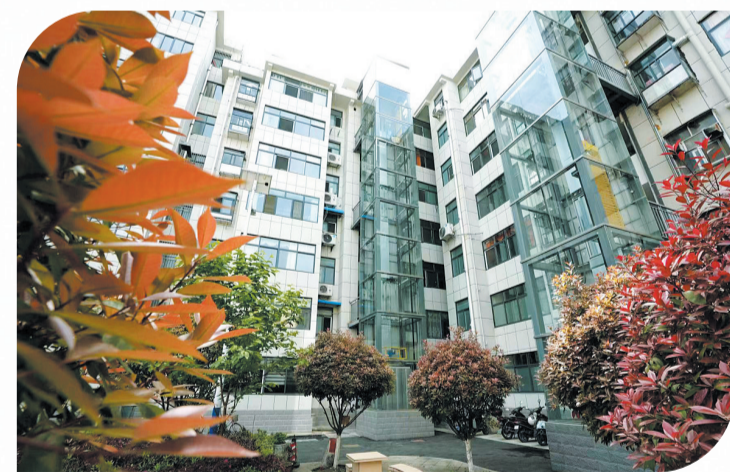
老旧小区改造让“老居民”乐享“新生活”