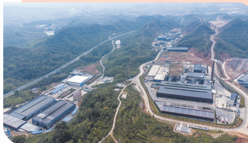
房县循环经济产业园