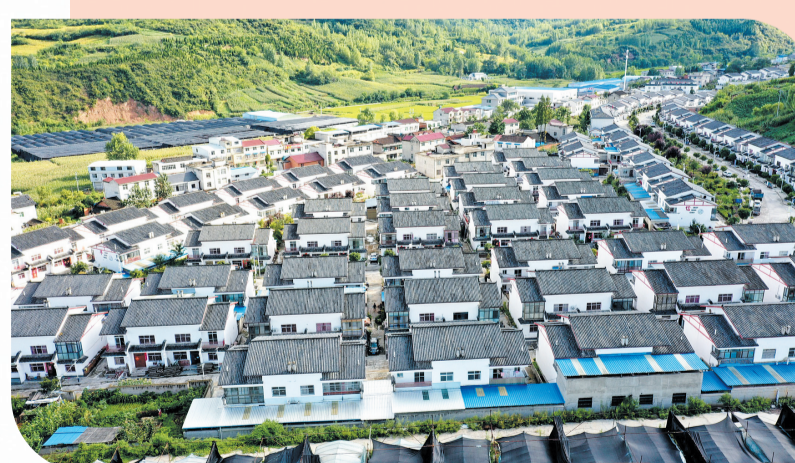
建设美丽乡村,共享美好生活