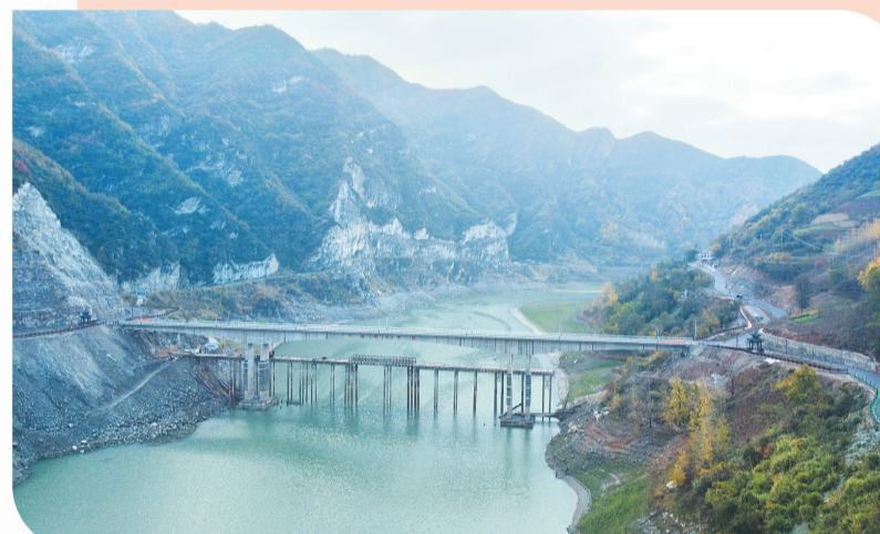
黄坪大桥建成通车