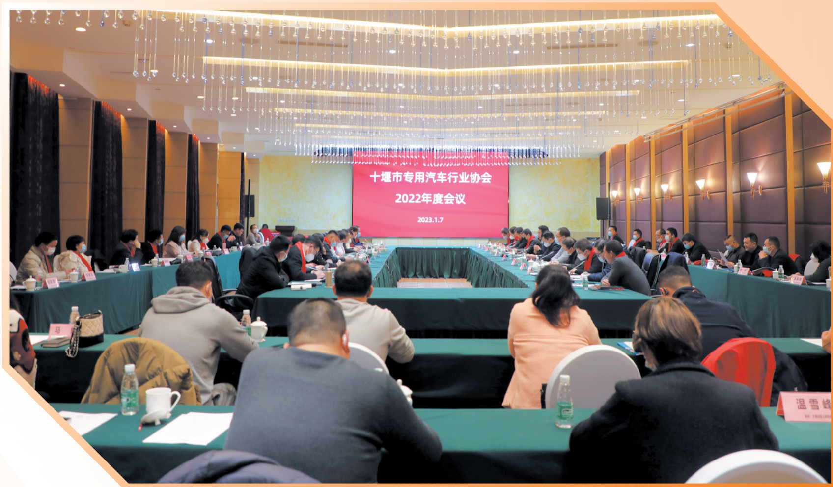
市专用汽车行业协会年会现场

1月7日，以“创新、变革、求存——共创新能源趋势下专用车发展新局面”为主题的十堰市专用汽车行业协会2022年度会议召开，60余家会长单位、副会长单位、秘书长单位、会员单位出席会议，涵盖整车企业、专用车企业、汽车销售企业、装备制造企业、零部件企业和汽车服务企业等全产业链条。年会进一步坚定企业发展信心，积极谋划行业发展新方向。