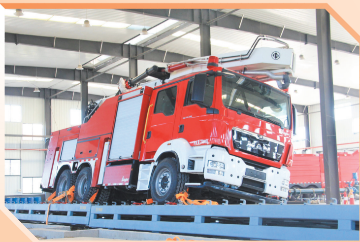
中翔(十堰)检验检测有限公司专用车检测线