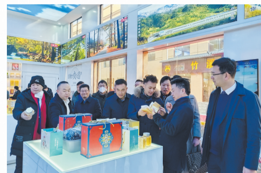
民营企业助力乡村振兴

引导民企投身光彩事业。积极鼓励和引导广大非公经济代表人士投身光彩事业，开展深度帮扶县、村“光彩事业行”活动、举办“家乡行”活动，以支援开发、项目开发、产业合作等方式，创造商机、互利双赢。打造服务光彩“双创”就业工作品牌，服务各类孵化器、众创空间、双创示范基地等平台载体快速发展。深化项目车间、卫星工厂、手工作坊等乡村振兴帮扶模式，促进县域特色项目规模化、产业化、品牌化发展。市光彩事业促进会向全市非公经济人士发出“万企兴万村”乡村振兴行动倡议书，引导广大非公经济人士积极投身美丽乡村建设，帮助产业振兴、消费振兴、就业振兴、