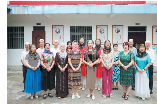
开展“弘扬核心价值观 共唱民族团结赞歌”活动

社会保障一张网。结合“大调研、大走访、大排查”活动，全市民族宗教部门工作人员深入乡镇(街道)、村(社区)，与少数民族群众谈心交流，对排查发现的各类问题困难，进行登记分类，落实专人、限期解决。其中，为民族特需商品定点生产企业落实贷款贴息资金60万元，为各民族群众解决生产、生活困难问题28件。疫情期间，帮助各民族困难群众解决生活困难资金2万余元。同时，大力开展社区民族事务网格化建设，构建互嵌式生活环境，为各族群众提供法律援助、