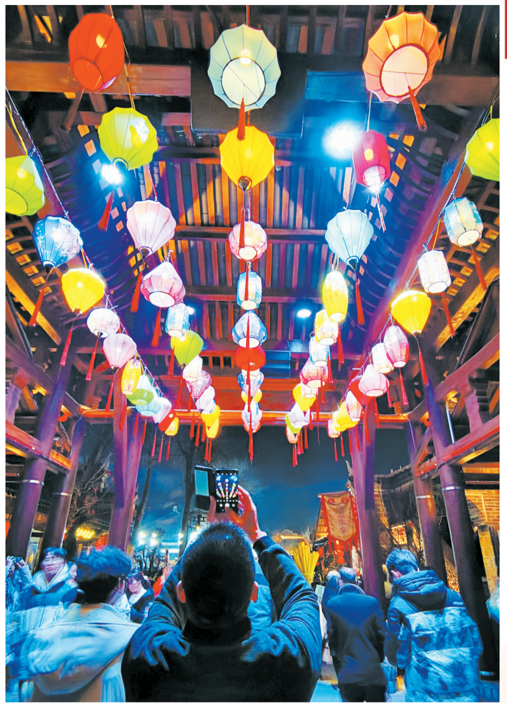
房县西关印象景区灯光秀精彩纷呈