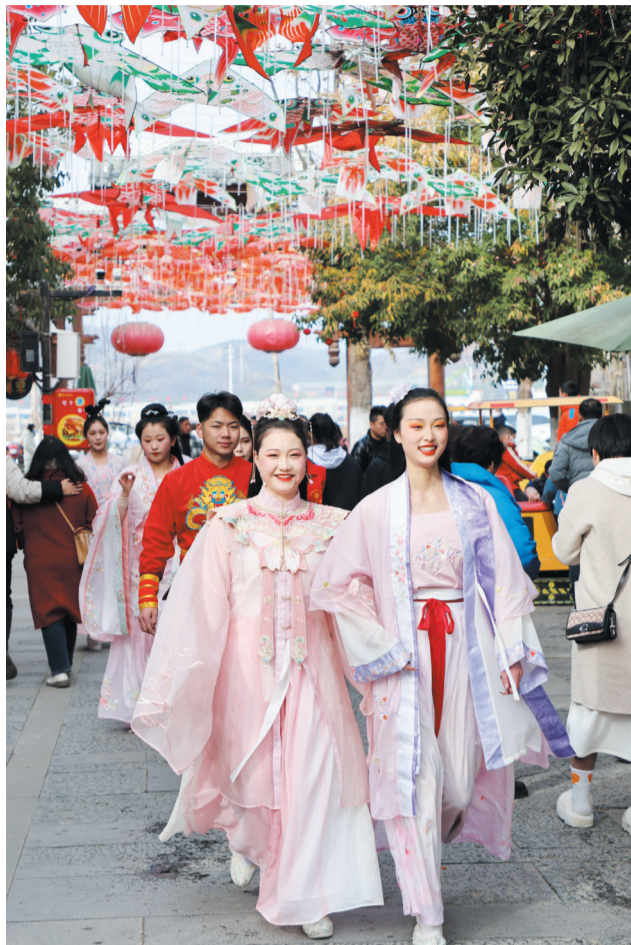
游客体验传统文化