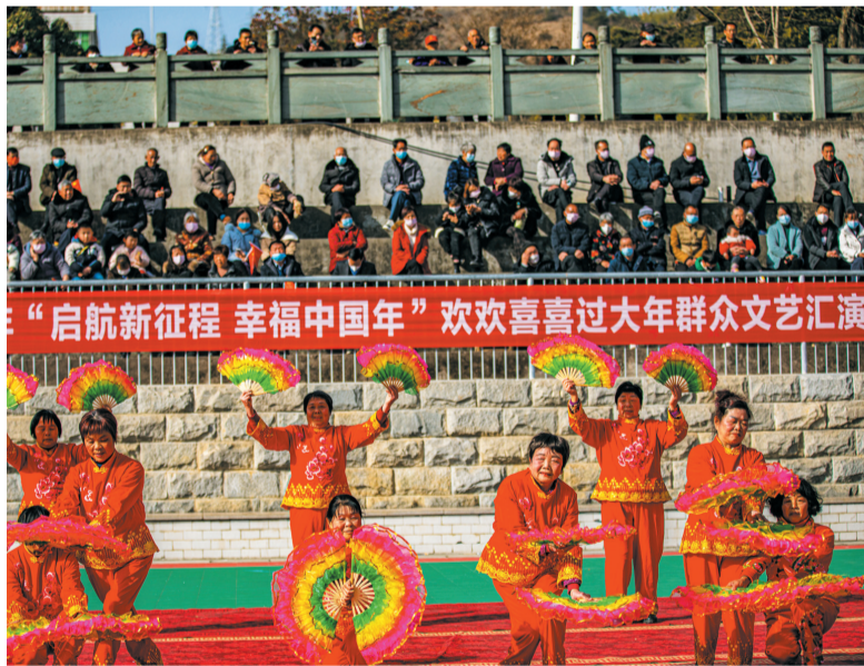
竹山文艺展演进乡村