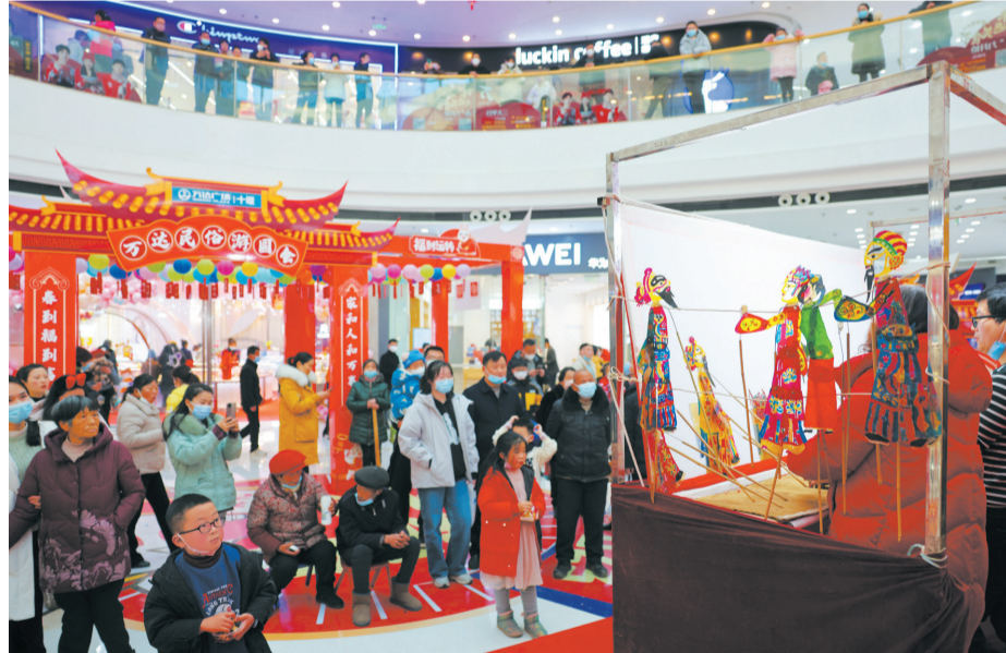
市民观赏万达广场民俗游园会皮影戏