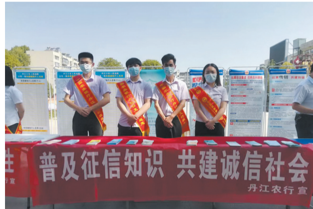
开展征信知识宣传活动