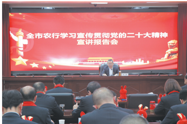
全市农行学习宣传贯彻党的二十大精神宣讲报告会

全面对接。该行第一时间向市政府汇报信贷融资意向，第一时间与项目公司对接融资服务方案，第一时间向省