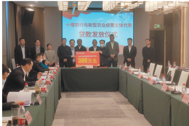
农行十堰分行向新型农业经营主体代表发放贷款