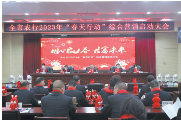
全市农行2023年“春天行动”综合营销启动大会

投放力度大。2022年以来，该行累计发放普惠贷款3719笔，金额达27.11亿元，其中发放普惠法人贷款872笔，金额达14.29亿元；发放普惠农户贷款2476笔，金额达8.16