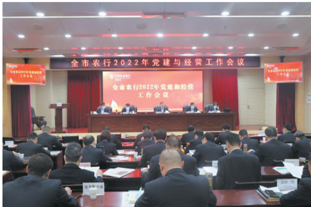
全市农行2022年党建与经营工作会议

奋斗成就精彩，实干赢得未来。2022年以来，农行十堰分行以学习宣传贯彻党的二十大精神为主线，紧紧围绕市委、市政府决策部署，全面落实“疫情要防住、经济要稳住、发展要安全”重要要求，持续加大信贷投放力度，不断提升服务实体经济质效，谱写了与全市经济“同频共振、共生共荣”的和谐篇章，为助力我市经济社会高质量发展交出了精彩答卷。