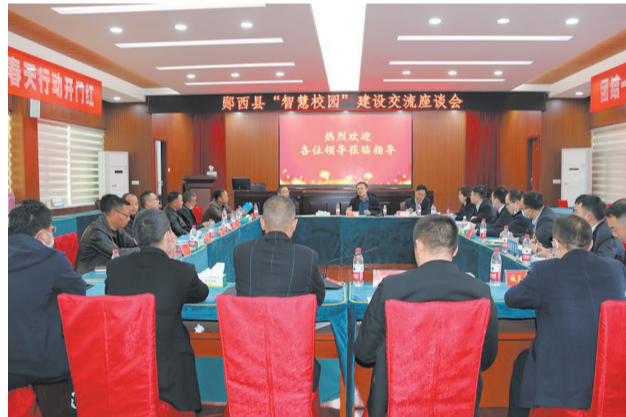
支持“智慧校园”建设