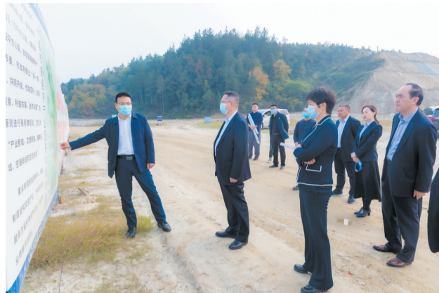
农行十堰分行主要负责人在十堰新经济产业园调研

定《金融纾困21条措施》，灵活运用宽限期、展期、无还本续贷等政策，对贷款实施临时性延期还本付息。