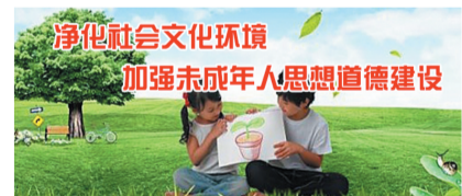
净化社会文化环境 加强未成年人思想道德建设

“中小学心理健康教育是学校教育的重要方面,是素质教育和思政工作的重要内容。”郧西县教育局相关负责人介绍,“我们将用三年时间培训一批合格的心理健康教育老师,确保每所学校有一名‘心灵使者’,初步构建起全县中小学心理健康教育体系,呵护孩子健康成长。同时以家校社共育为抓手,加强校园辅导、家庭辅导、社会服务,努力创设和构建良好的心理健康环境。”