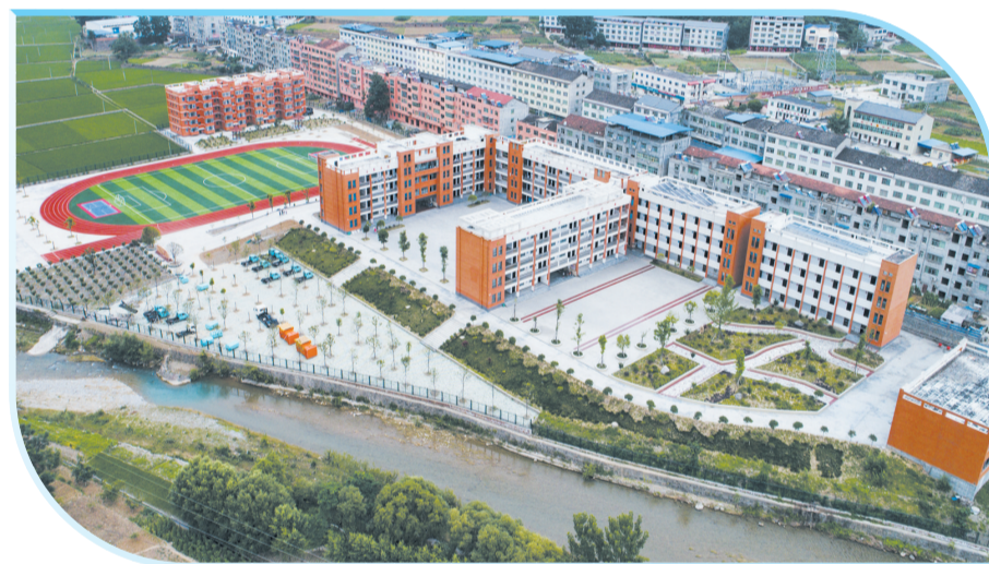
郧西县关防乡九年一贯制学校航拍。