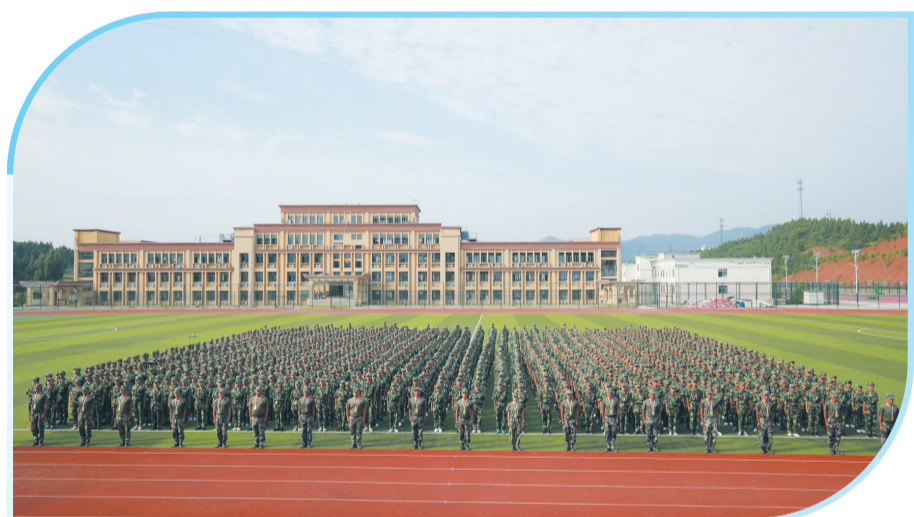
郧西县第一中学学生军训。

目前,该县已成功创建“湖北省学前教育示范县”,义务教育均衡发展通过国家督导评估,基础教育处于全市领先地位,职业教育跻身全省第一方阵。