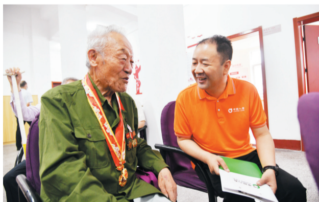
“关爱退役军人 关注健康保障”服务活动进社区

该公司积极开展乡村振兴相关保险业务,为丹江口市和郧西县边缘户、困难户、脱贫不稳定户等共计25万余人提供风险保额超75亿元;全年涉农保险长险保费目标达成率为94%,高于省内系统平均水平。加大专项投入和扶持力度,积极吸纳城镇居民就业,2022年公司新增就业和再就业岗位448个。积极提升客户服务效率和质量,重视消费者权益保护工作,持续提升理赔服务质效;树立底线思维,