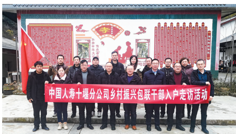
开展乡村振兴帮扶及干部包联“户户走到”活动

岁序更替,奋斗者行。汉口银行十堰分行人以正以时不我待的昂扬斗志奋发前行,以新担当新作为把奋进的足迹镌刻在“山水车城·宜居十堰”的广袤田野上。