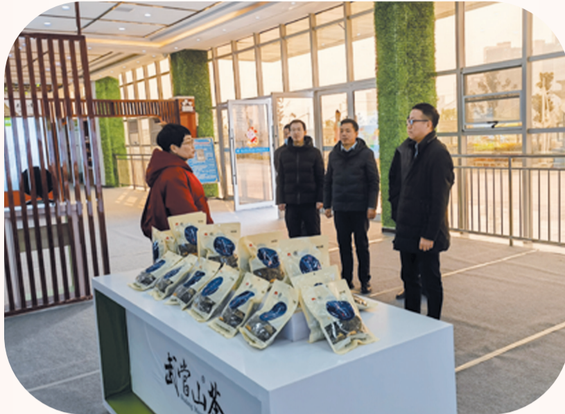
分行业务部门联合支行走访企业、宣讲金融产品