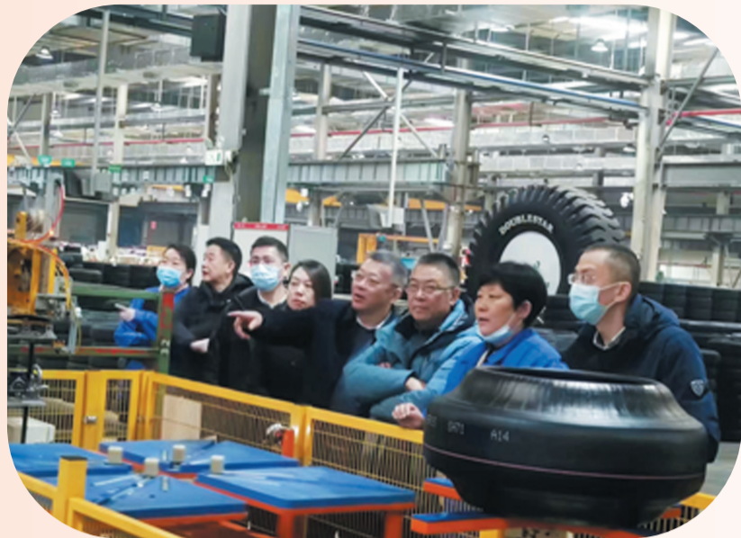
新年伊始,建行省、市分行领导深入企业考察