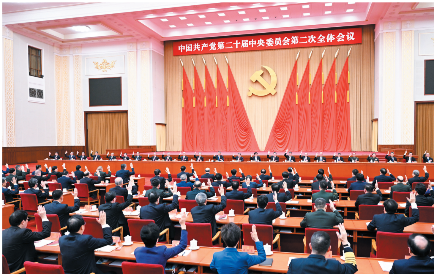
中国共产党第二十届中央委员会第二次全体会议于2023年2月26日至28日在北京举行。中央政治局主持会议。(据新华社)