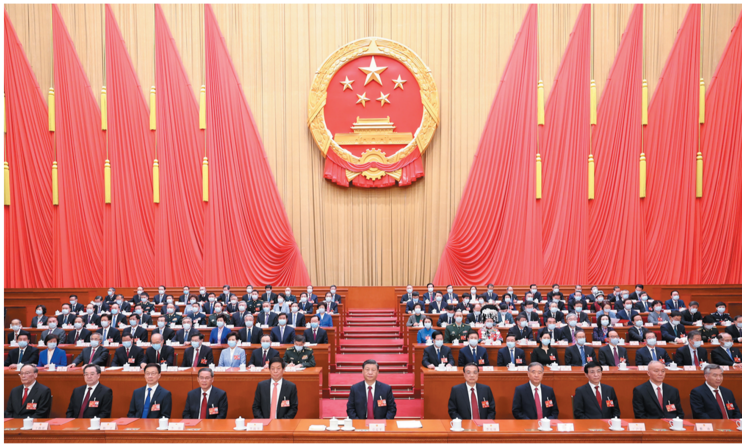
3月13日,第十四届全国人民代表大会第一次会议在北京人民大会堂闭幕。中共中央总书记、国家主席、中央军委主席习近平发表重要讲话。