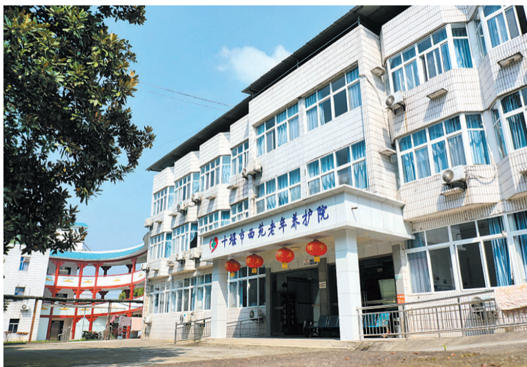
市太和医院西苑老年养护院外景

“未来,西苑养护院将努力把日常管理、老人起居等配套服务提高到一个新水平,让老年人幸福指数不断提升。”乐文随信心十足地说。