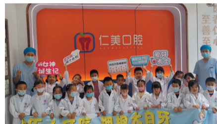
仁美口腔小牙医职业体验