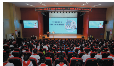
阳光小学儿童口腔健康科普