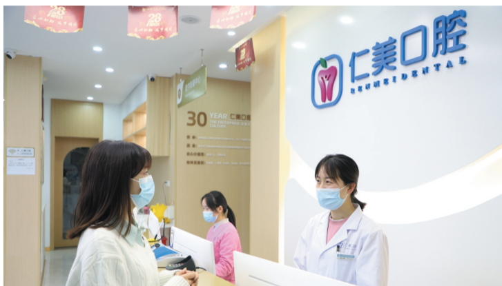
仁美口腔前台人员热情接待顾客