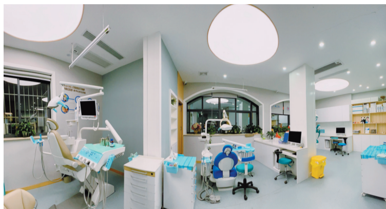
仁美口腔干净明亮的诊室

健康身体，从“齿”开始。在十堰，提起口腔健康，伴随车城发展壮大、成立至今二十九载的湖北仁美口腔医院已家喻户晓。