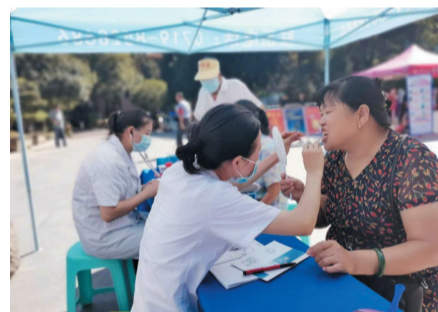
仁美口腔公益义诊