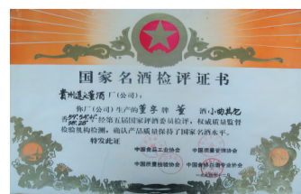
董酒荣获国家名酒证书