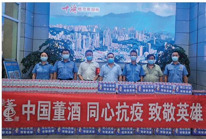
中国董酒捐赠5万元助力十堰战疫

“积力之举无不胜,众智之为无不成。”秉承汇利及仁之道,董酒还将以继承与发扬中国传统白酒健康文化为使命的同时,满怀感恩、不忘初心,热心公益、回馈大众,传递董酒的温暖与力量,传递董酒的真诚与美好。