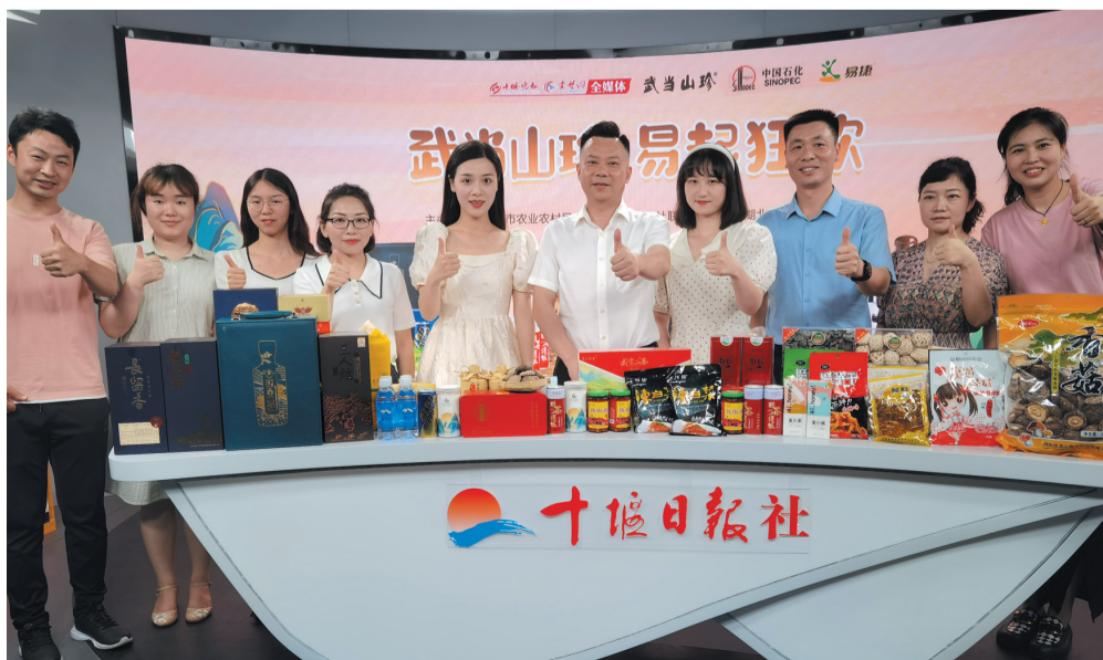
举办“武当山珍,易起狂欢”直播带货活动