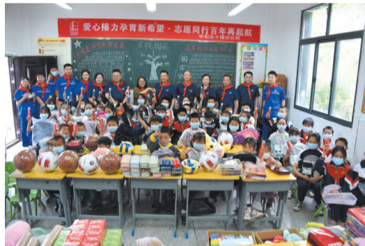
积极参与社会公益事业