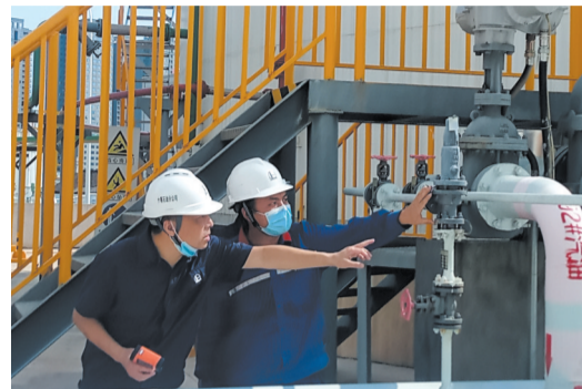
扛牢安全责任,坚守安全底线

服务绿色发展一如既往,打造业界品牌永不止步。未来发展,十堰中石化将以更大担当、更好服务,为助力我市经济社会高质量发展作出更多新的贡献。