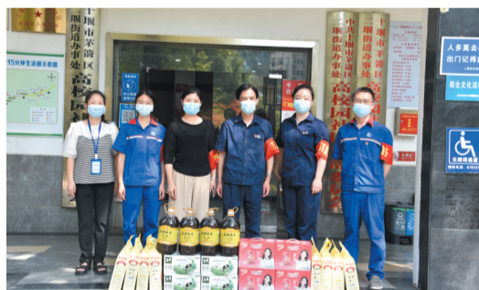
扎实开展包联社区工作