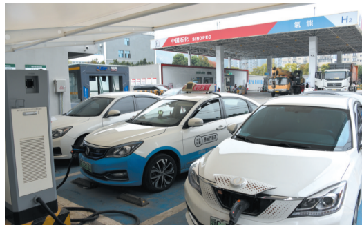
建设充电站,服务新能源车