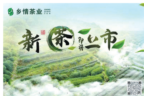
打造“乡情”茶业品牌