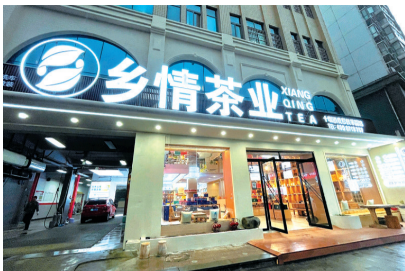
乡情茶业北京路旗舰店

春华秋实,耕耘不辍。历经十八载的洗礼,如今的乡情茶业从一家传统的茶产品零售商成功发展为一家拥有“圣情”“道山功夫”“道山红”等自创品牌以及68家“邻哥”新零售社区连锁加盟店的集团企业。公司先后被市委、市政府确定为“农特产品生产营销龙头企业”,且连续多年获得“农业产业化工作先进集体”“十堰市优秀企业”及“十堰市十佳企业”等称号。