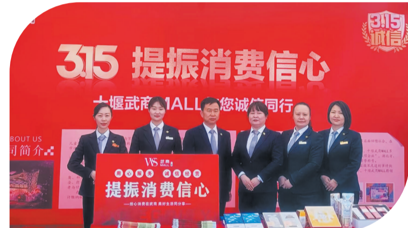
▲我市2023年“3·15”活动期间，人民商场现场为市民提供便捷服务