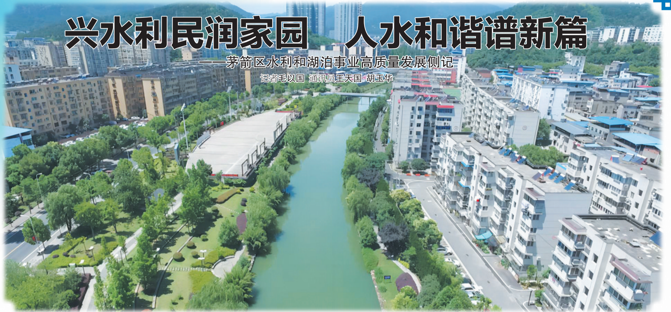
治理后的泗河一派诗情画意、人水和谐的景象

这是一幅千姿百态的山河美景图：水清河畅、岸绿景美、人与自然和谐共生，描绘大美茅箭水韵华章。这是一首荡气回肠的治水交响乐：流域综合治理、水生态修复、河湖长制等，演奏河湖安澜优美乐章。问渠那得清如许，为有源头活水来。盛世水利别样景的背后，正是茅箭举全区之力兴水惠民带给市民的生态红利。近年来，该区积极践行“十六字”治水思路，坚决扛牢“一库碧水永续北送”政治责任，全力推动水利湖泊事业高质量发展，为全区经济社会可持续发展提供有力支撑，有效增进全区民生福祉。