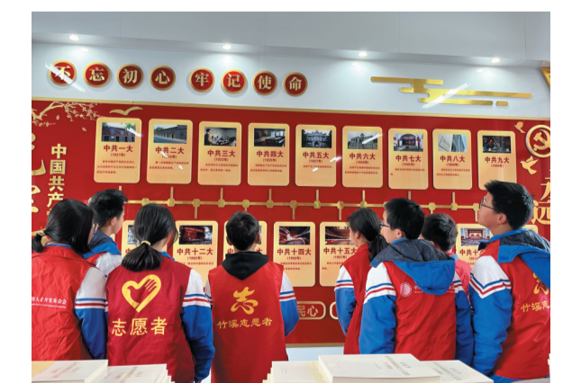
3月29日，竹溪县蒋家堰镇中心学校组织团员和少先队员来到学校红色党史馆参观学习，重温党的光辉历史，缅怀革命先烈。

此前，十堰艺术学校以“辞旧迎新，喜庆祥和”为主题，以传统节日为切入点，召开春节、元宵节主题班会，通过学生畅谈亲身体会、相互交流心得，引导学生充分感受中华优秀传统文化的魅力，树牢崇德向善、仁爱和谐、诚实守信、移风易俗、勤俭节约的价值取向，帮助学生树立正确的人生观、价值观、世界观，使学生自觉接受传统文化的洗礼，让内涵丰富、博大精深的中国文化融入血脉。