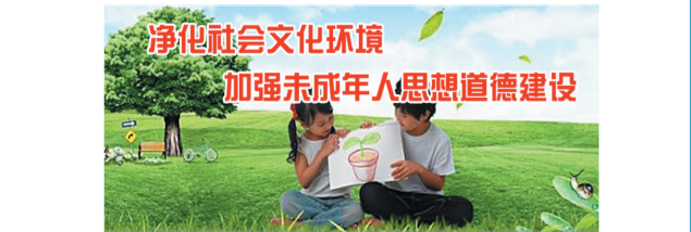
净化社会文化环境 加强未成年人思想道德建设