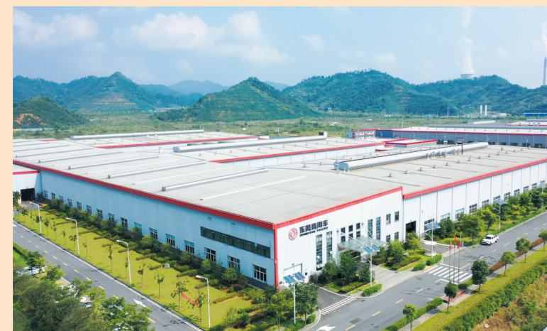
东风商用车重卡新工厂