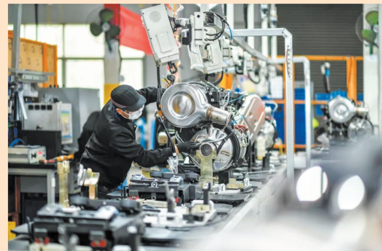
东风康明斯生产线

今年一季度,茅箭区锚定建设“首善示范区”目标,聚焦能力作风建设要求,以更强信心、更实举措、更优状态,全力拼经济、合力搞建设,全区呈现“开局就是决战”的新气象,彰显“起步就是冲刺”的新作为,成功实现一季度经济“开门红”,为全年高质量发展奠定了坚实基础。