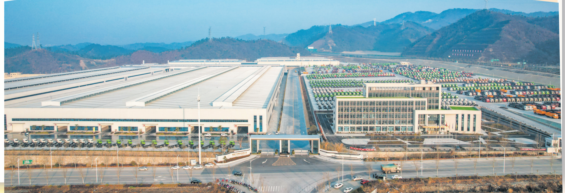
驰迪汽车股份有限公司