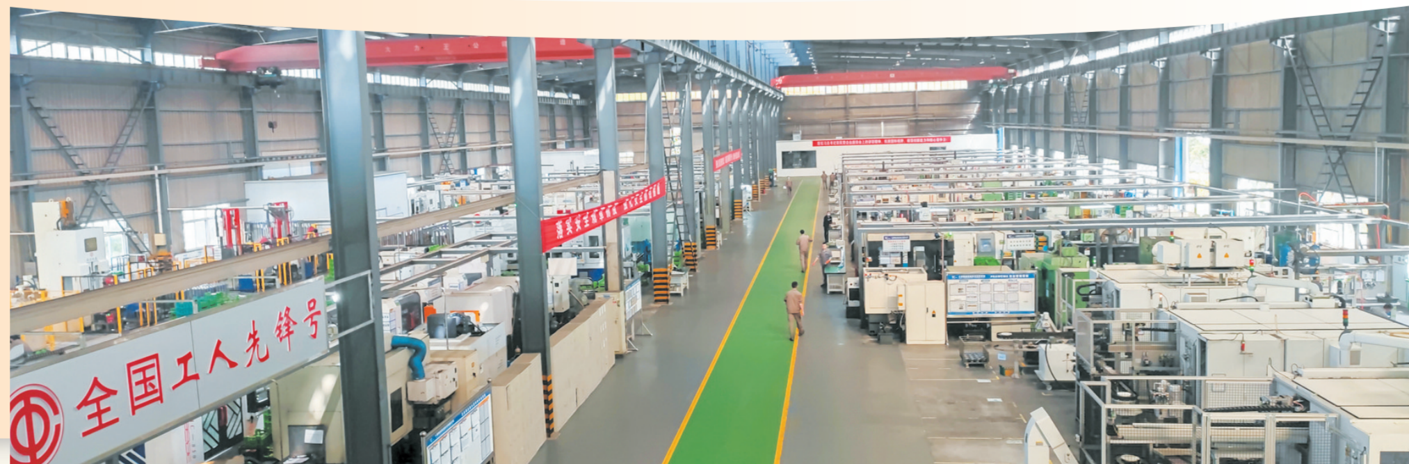
十堰同创公司生产车间

用个体登记智能秒批机,申领营业执照时间缩减至10分钟。 营造公平和谐市场环境。深化“证照分离”改革,优化流程,相较于以往办理流程减事项48.04%,减时限80.2%,减材料99.72%,减环节100%。加快推进诚信政府建设,在全区开展政府失信承诺,“新官不理旧账”,涉企乱收费协同治理等专项清理工作,通过多种渠道征集问题线索,建立以信用监管为基础的信用监管机制。 营造良好法治营商环境。持续深化“一站式”社会矛盾纠纷调处服务改革,实行线上线下“双线并行”,场内场外“联动协作”,诉前调解“全链贯通”的社会矛盾纠纷排查调处工作机制,将各类矛盾纠纷多元化化解“无缝对接”,实现“访调裁审”“一站式”定纷止争。多方联动整合资源,建成“商调超市”,实现“纠纷不出商圈、不出街区、不出园区”。 打造包容普惠开放环境。加大培育科技创新创业主体,打造“众创空间+孵化器+加速器+产业园区”全产业链链条。打造全市首家“网上惠企政策超市”平台,实现惠企政策“一站汇”,政策企业“速匹配”,政企互通“无障碍”,围绕高端人才引进、人才队伍素质提升、科技创新平台支撑、人才发展环境优化等方面提出18条突破性举措,促进形成人才集聚效应。 “开局就是决战、起步就是冲刺”,这是应有的姿态,更是发展的必需。一季度,茅箭区用不断发展的新成效,一季度“开门红”的含金量,以此为新的起点,该区还将掀起一个又一个“比拼赶超”的高潮,加快建设首善示范区,实现全年高质量发展的“满堂红”,为十堰建设绿色低碳发展示范区作出更大贡献。