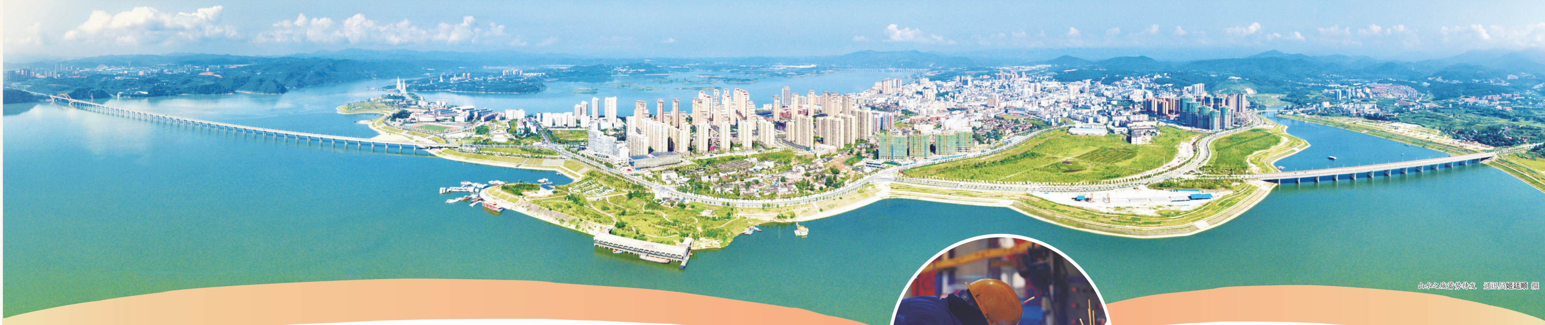
山水之城蓄势待发