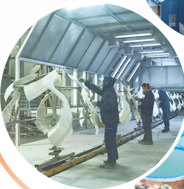
世泰任公司工人赶制订单产品