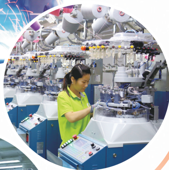
杨溪铺镇青龙泉社区棉农棉伴智能袜业生产车间