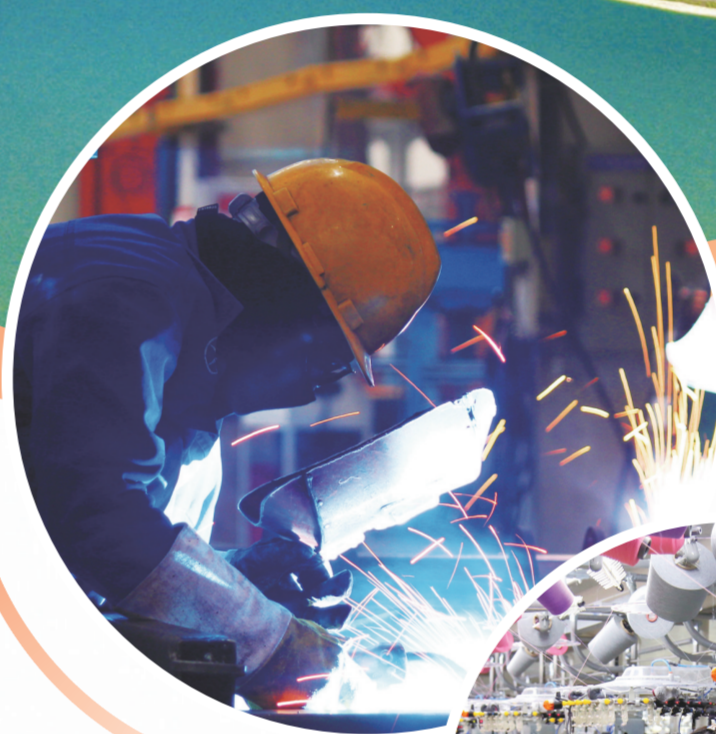
大运汽车生产