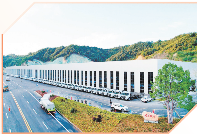
湖北一专应急救援专用车基地产业园