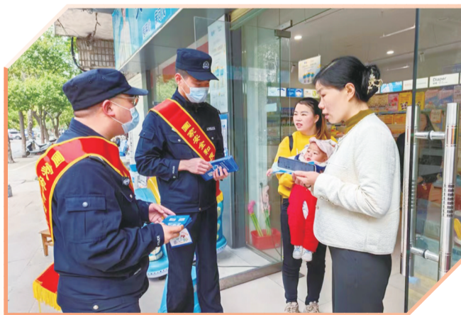
宣传国家安全知识