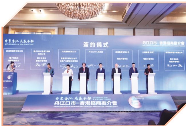
丹江口市在香港举办招商推介会

深化“雪亮工程”建设应用，先后帮助280余名群众找回失物，24名走失人员平安回家，为平安丹江口建设打下了坚实基础。