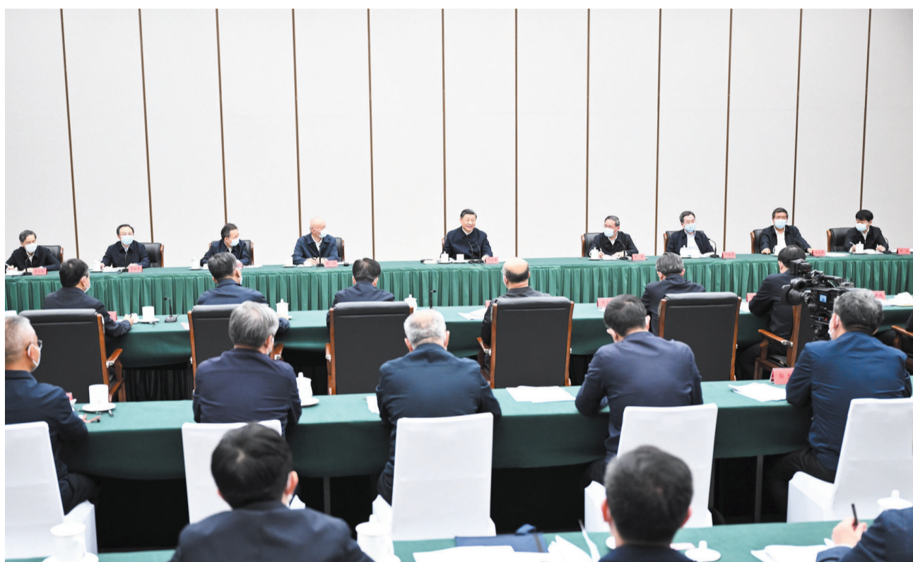
5月10日,习近平主持召开高标准高质量推进雄安新区建设座谈会并发表重要讲话。新华社记者燕雁 摄