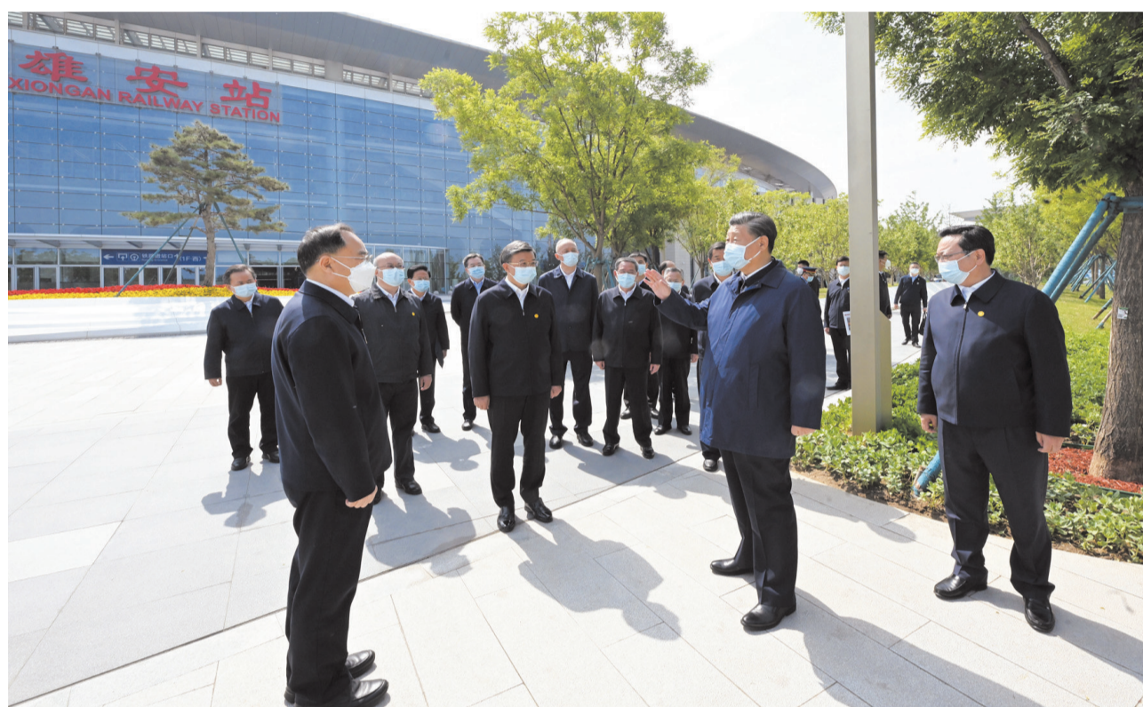
5月10日,习近平在雄安站考察。

新华社河北雄安新区5月10日电 中共中央总书记、国家主席、中央军委主席习近平10日在河北省雄安新区考察,主持召开高标准高质量推进雄安新区建设座谈会并发表重要讲话。他强调,雄安新区已步入大规模建设与承接北京非首都功能疏解并重阶段,工作重心已转向高质量建设、高水平管理、高质量疏解发展并举。要坚定信心,保持定力,稳扎稳打,善作善成,推动各项工作不断取得新进展。