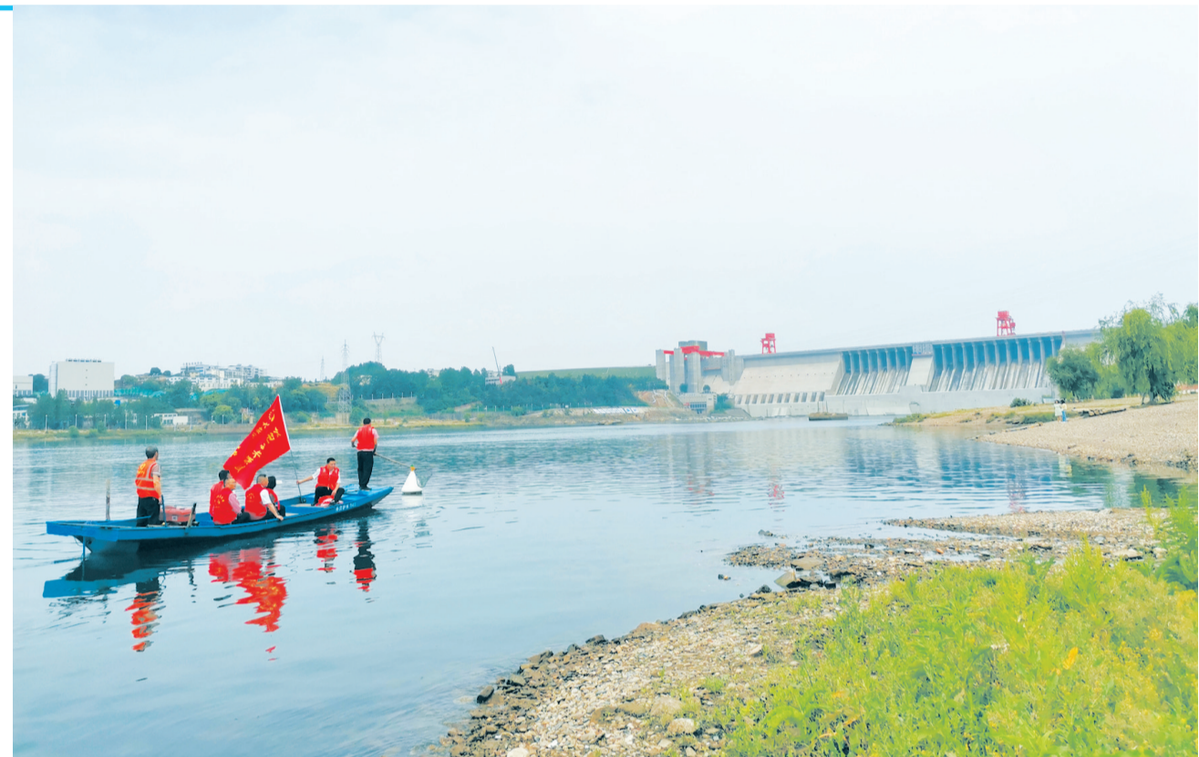
丹江口市大坝街道集团新村中帼志愿服务队、老街坊护水联盟的志愿者们对汉江沿岸垃圾、水面漂浮物进行清理