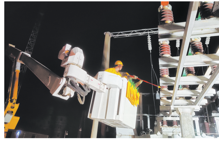
为顺利迎峰度夏,国网十堰供电公司将在高温大负荷来临前,在该站实施主变扩容工程,增加一台20

“当时修建公厕也是为了解决群众如厕难的问题,但是在落实过程中确实存在问题,我们马上整改到位。”五峰乡党委相关负责人表示。在巡察组的督促下,五峰乡党委