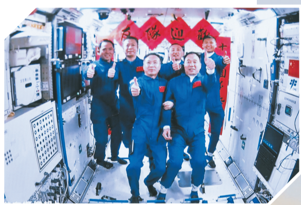
▲5月30日在北京航天飞行控制中心拍摄的神舟十五号航天员乘组与神舟十六号航天员乘组拍下“全家福”的画面。