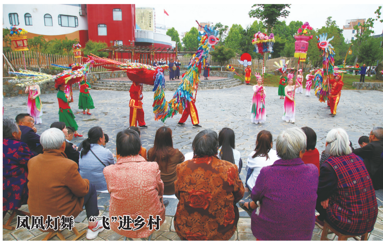
凤凰灯舞“飞”进乡村

太和医院“岗位大练兵 业务大比武”活动的深入开展，有力促进了全院医务人员能力提升、作风转变，推进了医院医疗业务工作。全院各科室竞相开展新技术研发，今年上半年共申报立项新技术新技术100项，推进了医院业务发展、医疗和服务质量提升。