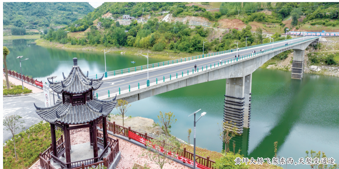
黄坪大桥飞架东西，天堑变通途

忆往昔，万众一心、顽强拼搏；看今朝，踔厉奋发、接续奋斗。在充满希望的田野上，一粒粒种子正积蓄向上生长的蓬勃力量，一代代姚坪人正在将一幅幅美好愿景变为现实图景。