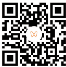
扫码浏览“水乡姚坪茶旅小镇”视频

全乡总面积204平方公里，耕地19101亩，水域面积1.8万余亩，山场面积21万余亩，辖16个村48个村民小组5300户17469人，其中移民9502人。近年来，姚坪乡围绕“水乡姚坪、茶旅小镇”的发展定位，紧抓乡村振兴发展机遇，努力开创经济社会各项事业发展新篇章，2021年荣获“省级先进基层党组织”称号。