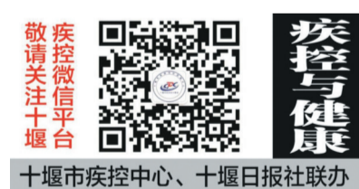
十堰市疾控中心、十堰日报社联合

还将联合市教育局陆续开展专家访谈、控烟绘画征集、专家义诊与戒烟服务等活动,进一步加大控烟宣传和健康教育工作力度,营造无烟、清洁、健康、文明的校园环境。