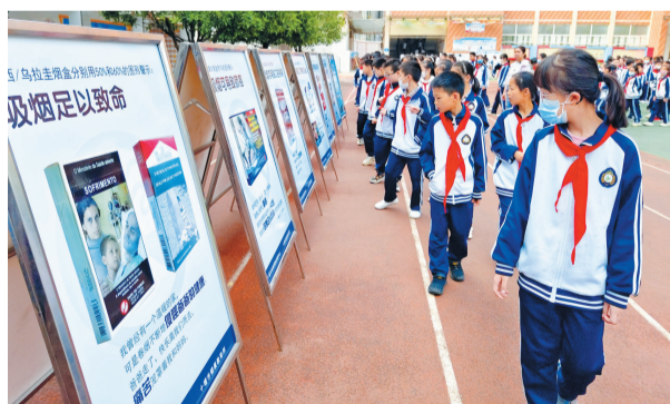
学生参观控烟知识宣传展板

本报讯 记者刘俊 通讯员校益章 毛一军报道:“我宣布,十堰市第36个世界无烟日控烟宣传进校园暨中小学生‘拒吸第一支烟 做不吸烟新一代’签名活动正式开始!”5月30日上午,由市卫健委、市教育局、市疾控中心等单位牵头开展的无烟日宣教活动走进市实验小学,为广师生带去无烟健康知识。