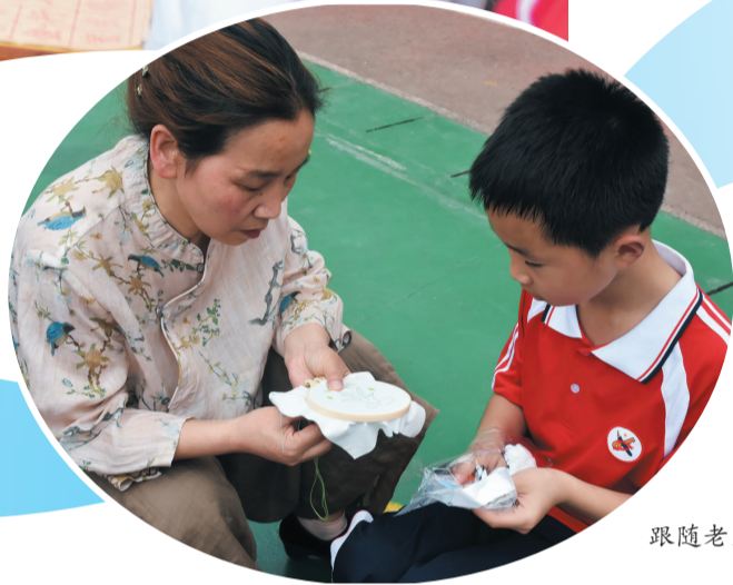
跟随老师学习刺绣

中华优秀传统文化源远流长,从小接触传统文化,学习领会其思想精髓,对青少年树立正确的世界观、人生观、价值观大有益处。近年来,房县实验小学紧紧围绕“立德树人”根本任务,加强中华优秀传统文化教育,让孩子们能够真正领悟“传统之美”。