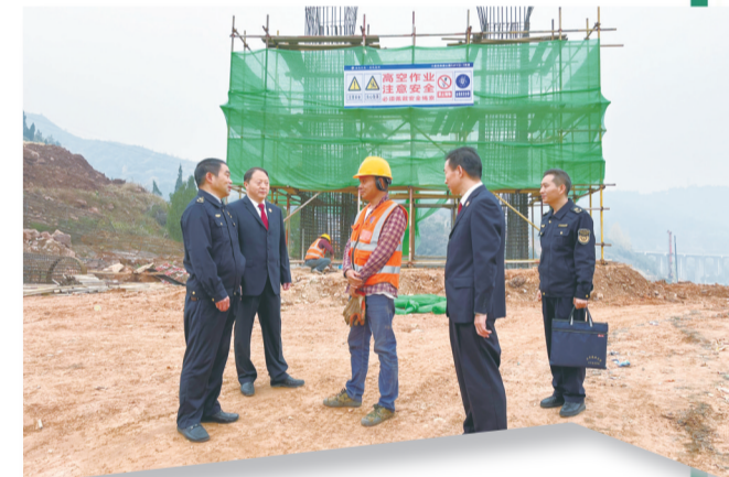
市生态环境局郧西分局联合县人民检察院对建筑工地开展检查