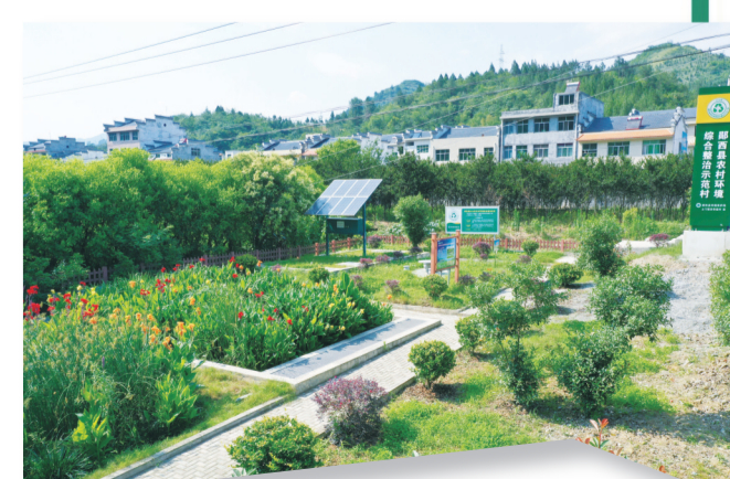
土门镇关帝庙村农治设施