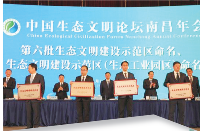
2022年郧西获评国家级生态文明建设示范区