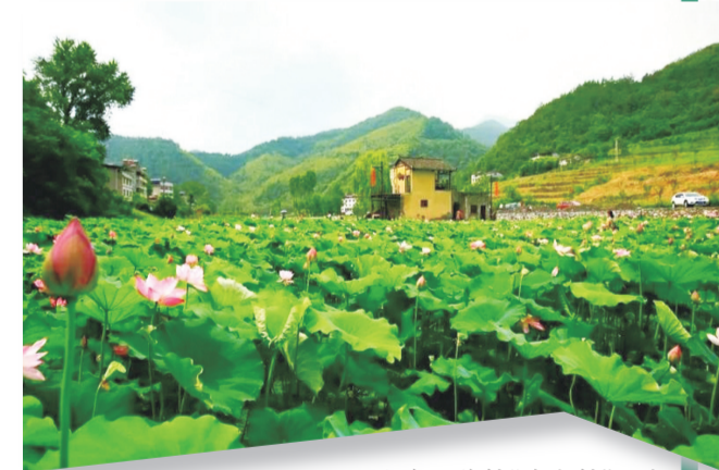
洞池乡下营村“淘宝村”风光