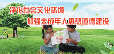
净化社会文化环境 加强未成年人思想道德建设

6月4日下午，“新时代的接班人”红色艺术展演在招商花园城开幕。此次展演是第五届“致敬英雄”全国青少年文化艺术创作主题教育竞赛其中的一个赛项。该竞赛由中国少年儿童文化艺术基金会主办，十堰日报社教育周刊、十堰招商花园城承办。因为城区晶晶幼儿园带来的舞蹈《平安鼓》。