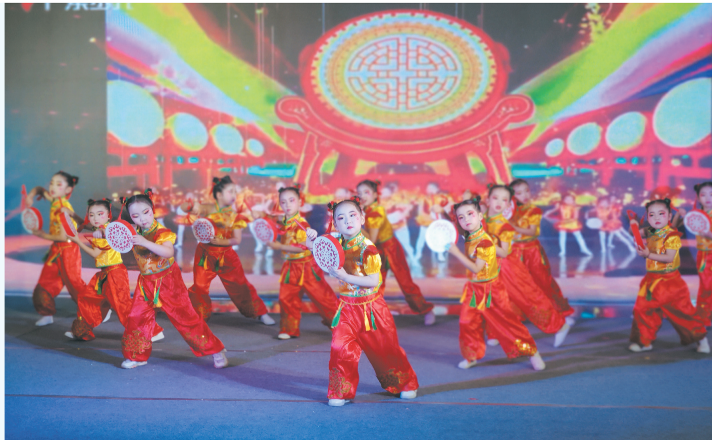
十堰职业技术（集团）学校举办职教活动周文艺展演