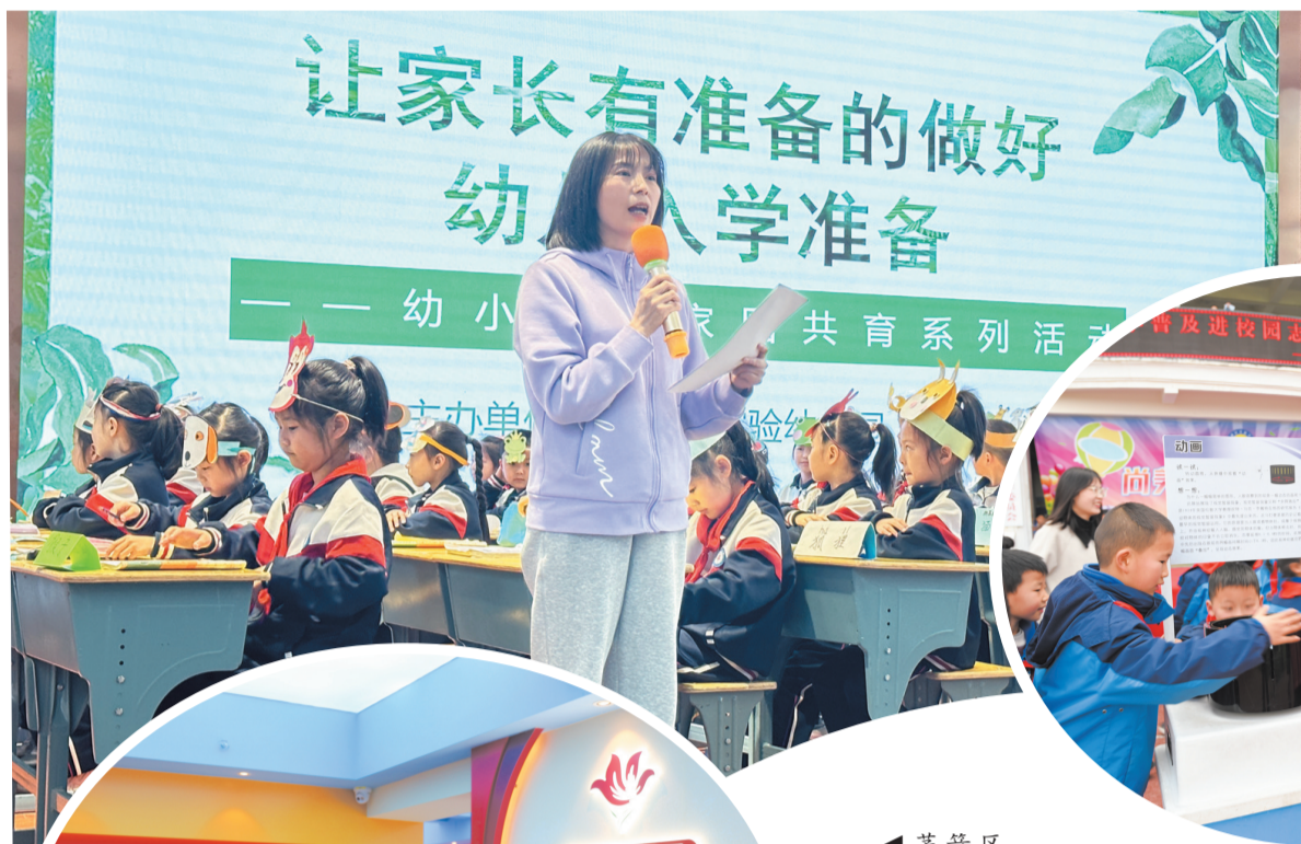
市实验幼儿园与市五堰小学开展幼小衔接主题活动

4月18日，市苗苗幼儿园开展以“双向奔赴 共育花开”为主题的家长开放日活动。各班教师从幼儿一日生活环节、幼小衔接工作、家园共育等方面向家长进行详细的介绍和说明，让家长了解孩子在幼