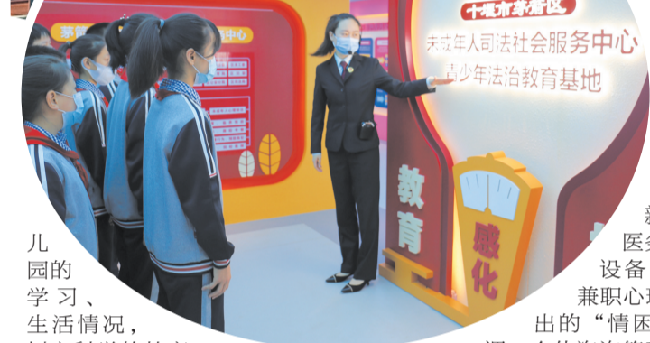
茅箭区武当路小学走进茅箭区检察院青少年法治教育基地