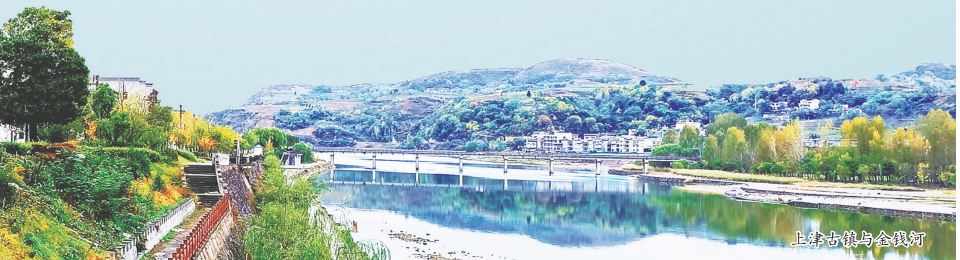
上津古城与金钱河