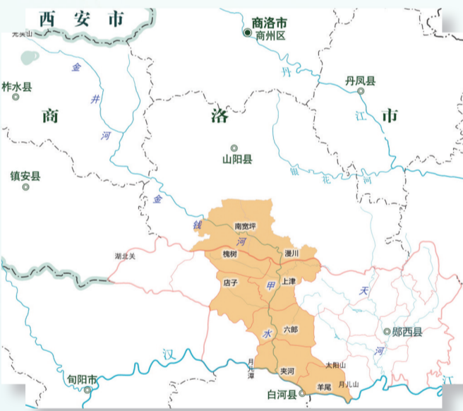
古甲国大致范围图(图中橙色部分)

远古时期的先民，很难知晓河流的全长，分段命名。古人把全长261公里的金钱河分为三段，每一段都有历史渊源：上段金井河。据《中国水系辞典》，金