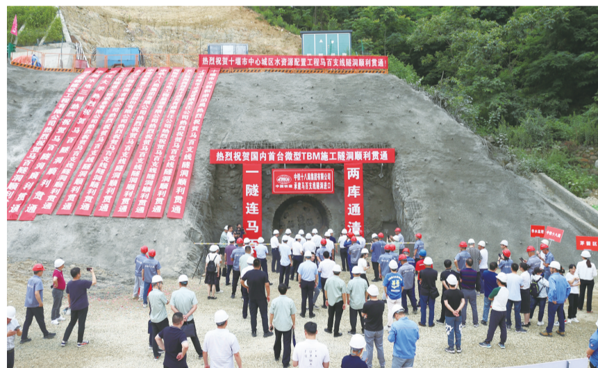
马百支线隧洞贯通仪式

6月21日上午9时28分，随着一声轰鸣，“水源号”全断面硬岩掘进机(TBM)刀片破岩而出。“通了！通了！”建设者们欢呼雀跃、击掌拥抱……经过619个日夜的艰苦奋战，全长4155米的十堰中心城区水资源配置工程马百支线(马家河水库至百二河)隧洞顺利贯通，工程朝着全面完工目标迈进了至关重要的一步。