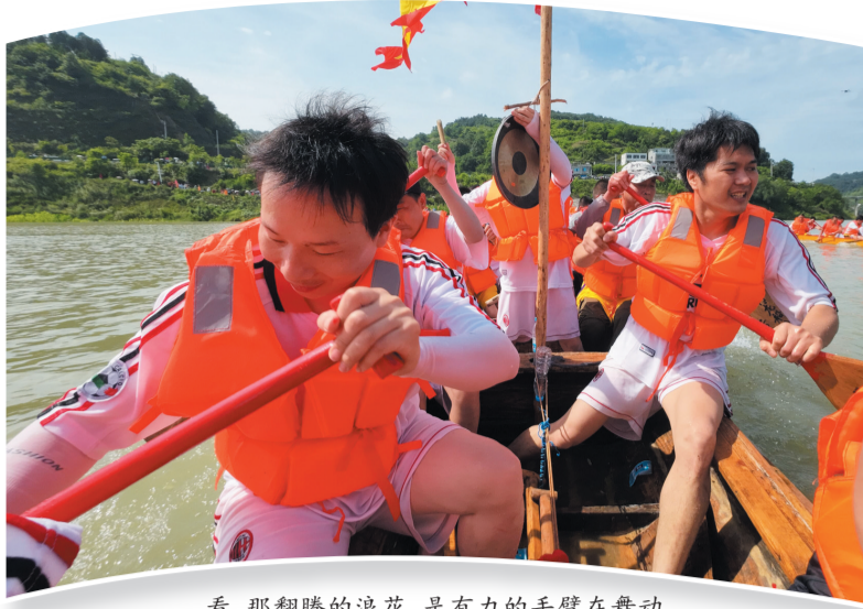
看,那翻腾的浪花,是有力的手臂在舞动