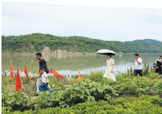
韩家洲外迁移民:“春节可以回老家,但端午节一定要回来看看。”

赛者投入、观者热烈的背后,轮值“会首”一年来的操劳,端午节当天“出标人”的慷慨,以及当地人对这项比春节的重视……是这项历史悠久的文化活动驶过时间长河,依然鲜活无比的秘密。