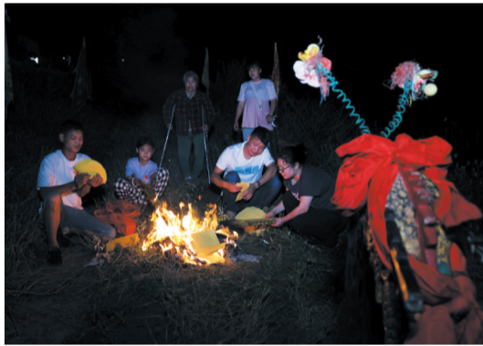
俭朴而隆重的祭龙仪式