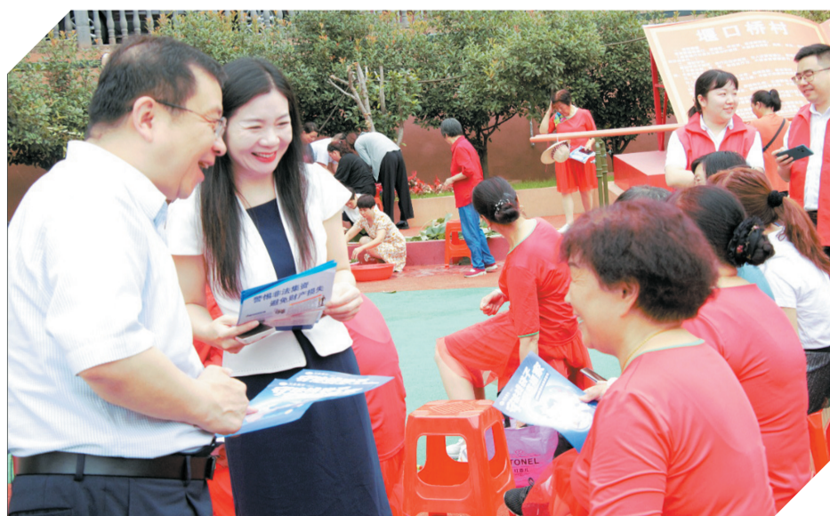
在社区开展防范非法集资宣传活动