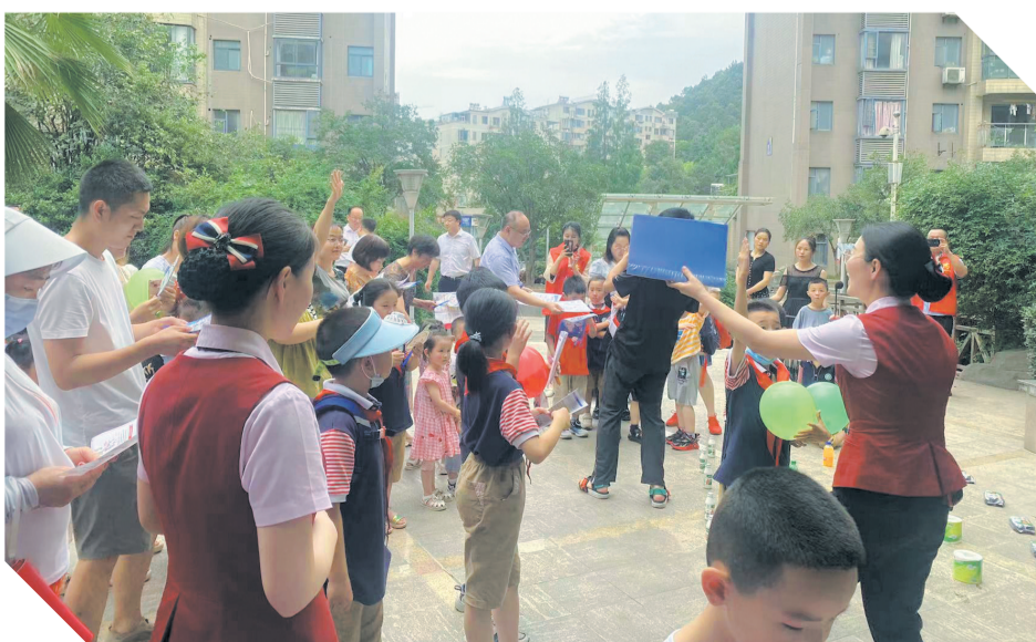
向小区居民讲解金融知识