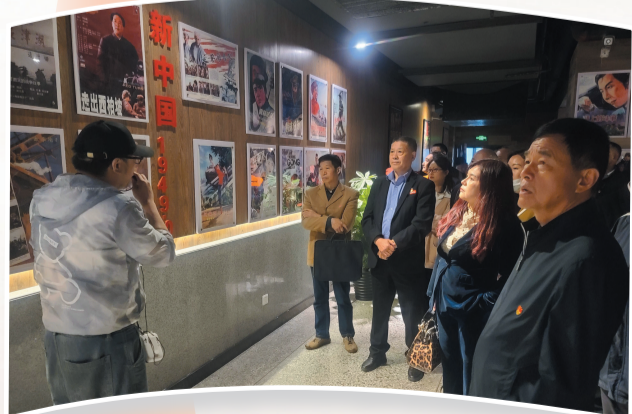
茅箭区“两新”组织党组织书记现场观摩交流党建工作经验