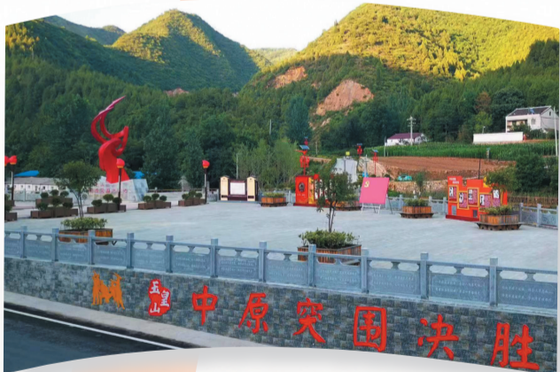
“红色美丽村”郧阳区南化塘镇玉皇山村打造乡村振兴样板