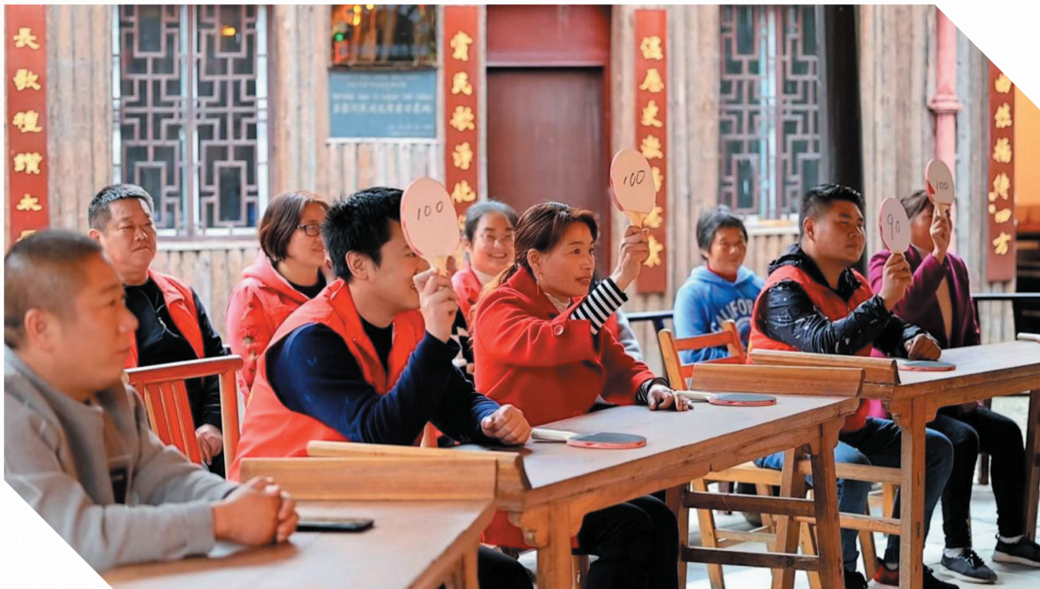
丹江口市官山镇吕家河村运用“共同缔造”理念和方法发动群众参与乡风文明建设

今年以来，全市各级党组织牢固树立大抓基层鲜明导向，着力增强党组织政治功能和组织功能，把基层党组织打造成适应绿色低碳发展示范区建设要求的坚强战斗堡垒。在乡村振兴、基层治理、生态环保第一线，在经济发展、项目建设、招商引资最前沿，处处都有党员干部担当作为、攻坚克难、砥砺奋进的身影，他们以过硬的能力作风推动创一流、争第一、干唯一。