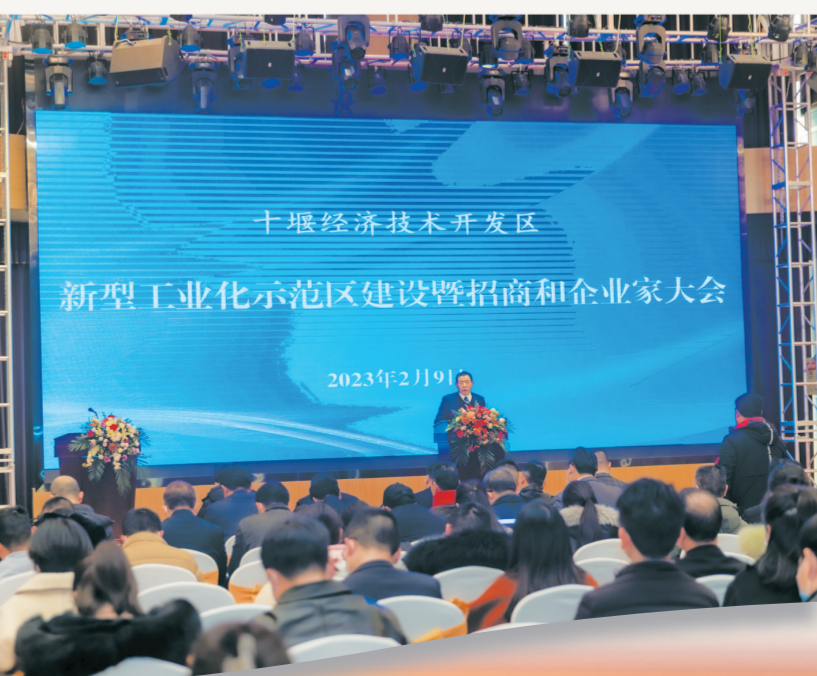
新型工业化示范区建设暨招商和企业家大会