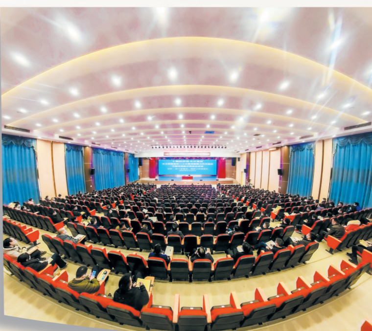
能力作风建设专题培训

时刻贴近群众,心中装着群众,坚持厚植为民情怀,全力办好民生实事。 今年以来,经开区全体党员干部坚持“共同缔造”理念,聚焦民生项目建设,不断提高政治站位,持续展现责任担当,以扎实开展“五亮五共”等实践活动为抓手,不断提升社会共治能力,持续提升群众生活品质。 在民生项目建设上, 完成产城融合总体规划,编制《经开区新型城镇化建设三年行动方案》;下发《经开区新型城镇化三年行动任务清单》共计7大类、70个项目,总投资318.29亿元;辖区海口路综合改造项目完成75%;全民健身中心项目完成70%;人才孵化中心建设项目近期开工建设;天盾花园和台湾路2个老旧小区改造项目全面开工;马路村二组水改工程正在进行收尾,铺设供水管网约3800米;通过加快辖区流域治理,持续打造良好生态环境,维修更换破损环保设施51处、清淤疏通12处、新建管网设施17处,整改率为100%;扎实开展“五亮五共”实践活动,全区1355名党员干部到居住社区报到亮身份,领办承诺事项2156件,到居住地下沉参与“五亮五共”活动1627次;全区36家单位407名机关党员干部认领急难愁盼事项和群众微心愿434件;100%按时完成任务39个红色物业小区党支部换届工作;组建125支志愿服务队,聚焦空巢老人、留守儿童以及特困群体,开展志愿服务活动2200余场次。 一条条宽阔的马路绿树成荫,一座座现代化工厂高端智能,政治生态风清气正,经济社会繁荣稳定,群众生活更加幸福……如今的经开区,正以十足的信心为建设新型工业化示范区、打造中国式现代化十堰样本铆足干劲、奋力冲刺。