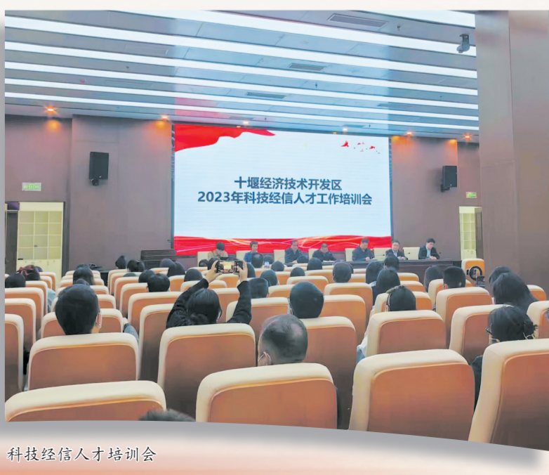
科技经信人才培训会