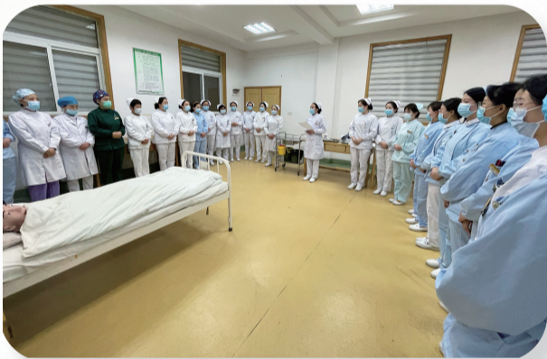
4月初，市中医医院开展“提能力 转作风”业务拉练活动，医务人员相互学习、相互促进，掀起“比学赶超”的热潮。