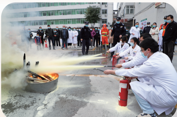
1月底，市中医医院组织全院干部职工开展安全应急演练，增强医务人员的安全意识。