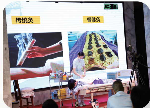
年初，市中医医院承办全市中医绝活大比武，30多个中医医疗机构同台竞技，加强沟通交流，提升了中医药服务能力。