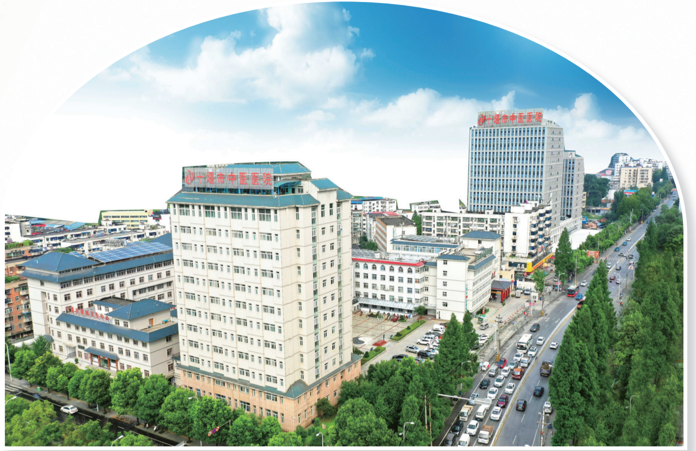
市中医医院鸟瞰图

今年以来，市中医医院高扬党建引领风帆，乘着加强能力作风建设的东风，引领全院党员干部职工奋楫笃行守初心、踔厉奋发勇担当、善作善为建新功，开启了医院高质量发展新征程。