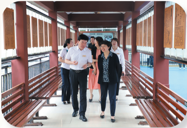
6月16日，国家心理健康和精神卫生防治中心副主任黄长群（前排右）一行莅临市中医医院调研，对医院心理健康和精神卫生防治工作给予高度评价。