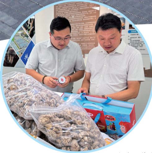
了解食用菌产品情况