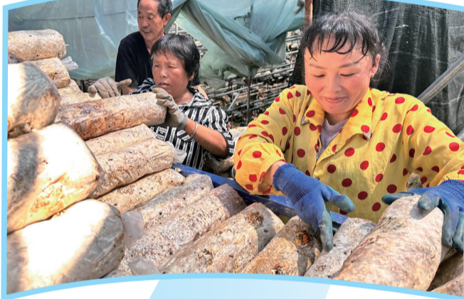
新洲镇香菇菌棒生产车间

下一步，竹溪县将紧紧围绕绿色低碳发展示范区建设目标，不断扩大香菇种植规模，做深食用菌提取产品、即食食品、调味品等精深加工，通过联合创品牌、携手闯市场，推动产业集聚、能级提升、链条延伸，为乡村振兴注入强劲动力。