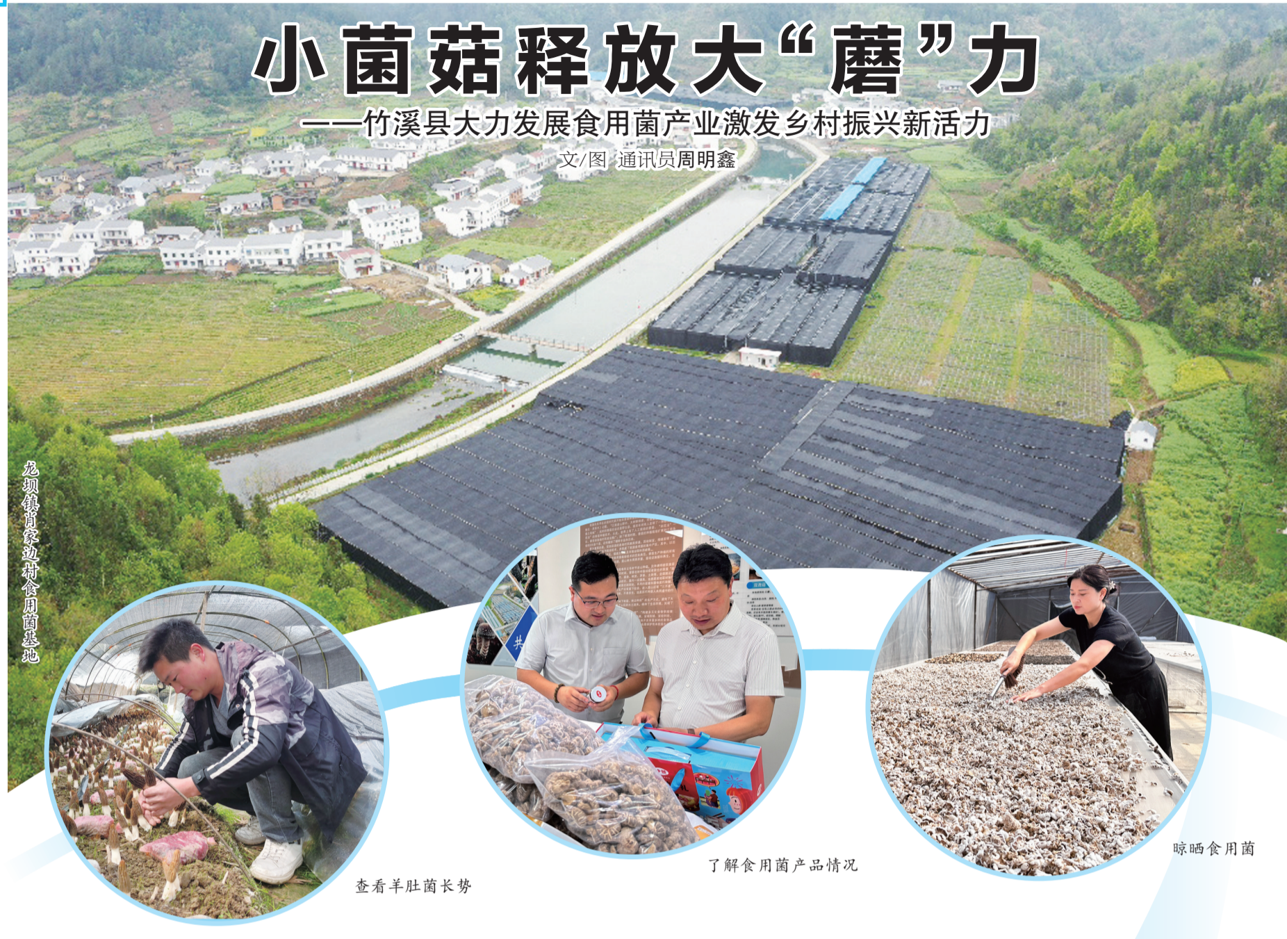
龙坝镇黄家湾食用菌基地