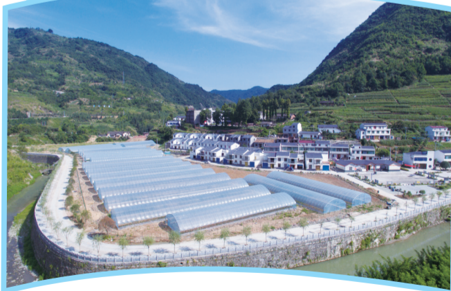
兵营镇食用菌产业基地