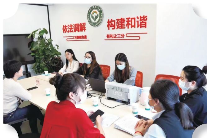
市人社局积极开展和谐劳动关系创建