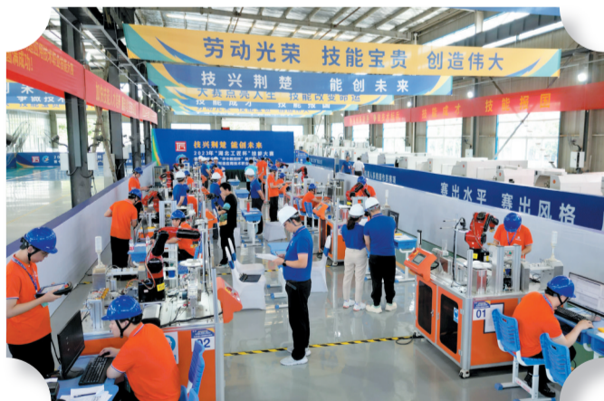
由十堰市人社局等承办的2023年“湖北工匠杯”全省工业机器人系统操作员技能竞赛