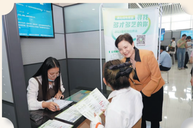
省人社厅党组书记、厅长刘艳红调研“百县进百校”就业招聘活动