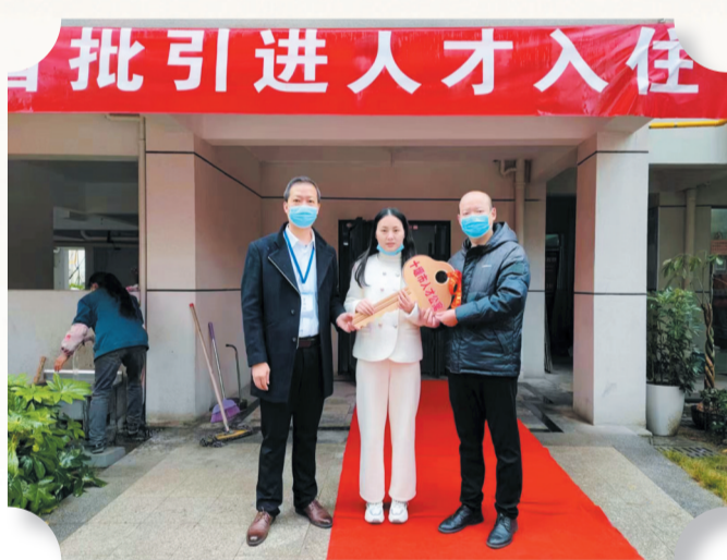
为引进的人才发放人才公寓钥匙