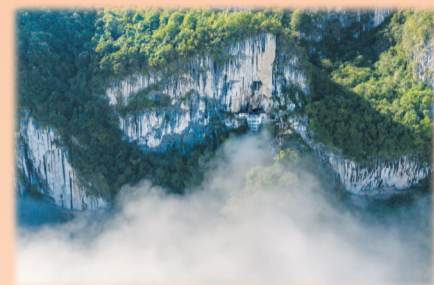
槐树仙姑洞，1935年红二十五军驻扎休整的地方(资料图片)

郧西是一片红色沃土，是长征国家文化公园建设重点县。1934年12月至1937年8月，红二十五军主力及红七十四师在这里创建与巩固鄂豫陕革命根据地，而槐树沟是红二十五军的重要活动地和进出鄂陕的重要通道。