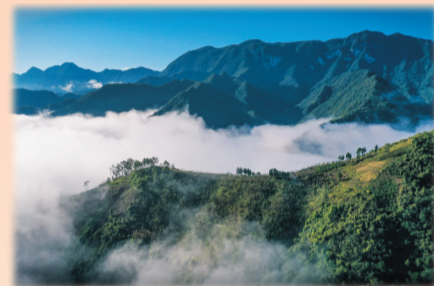
巍巍湖北大梁(资料图片)