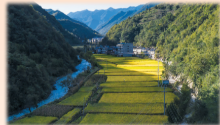
槐树沟和沔阳河，红二十五军活动的重要见证地(资料图片)