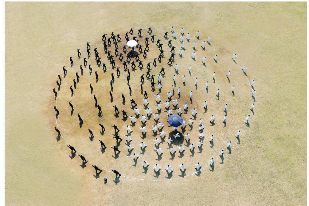
太极之美

1.2004年12月，和氏太极拳传人和有禄状告《武当》杂志社名誉侵权案，案由源于对太极拳发源与创始人的观点争执进而出现人格贬损和人身攻击。央视“今日说法”栏目报道了案情经过。此案堪称