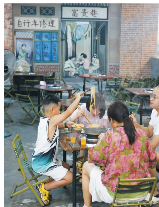
上海路文荟街区里充满怀旧气氛的火锅店。

过去摩托车停车位是用铁栅栏圈出区域，此次改造后，铁栅栏被高低错落的书籍造型取代。在灯光映照