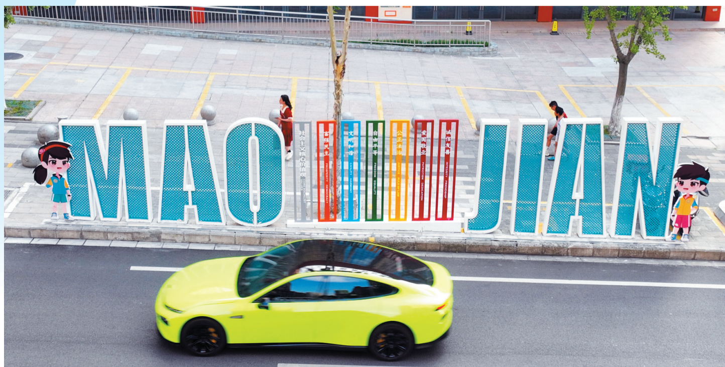
上海路新打造的社会主义核心价值观宣传牌。

我们深信，正在“蝶变”的上海路，必将成为改善城市功能、助力经济发展、提升生活品质的新标杆！