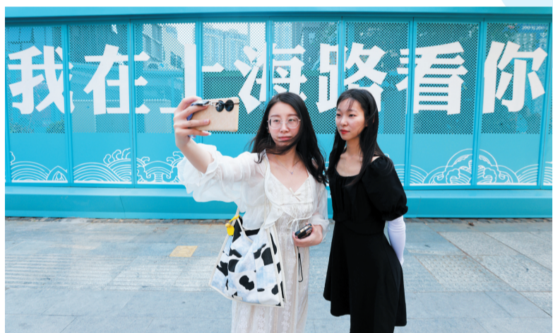
市民在上海路拍照留影。