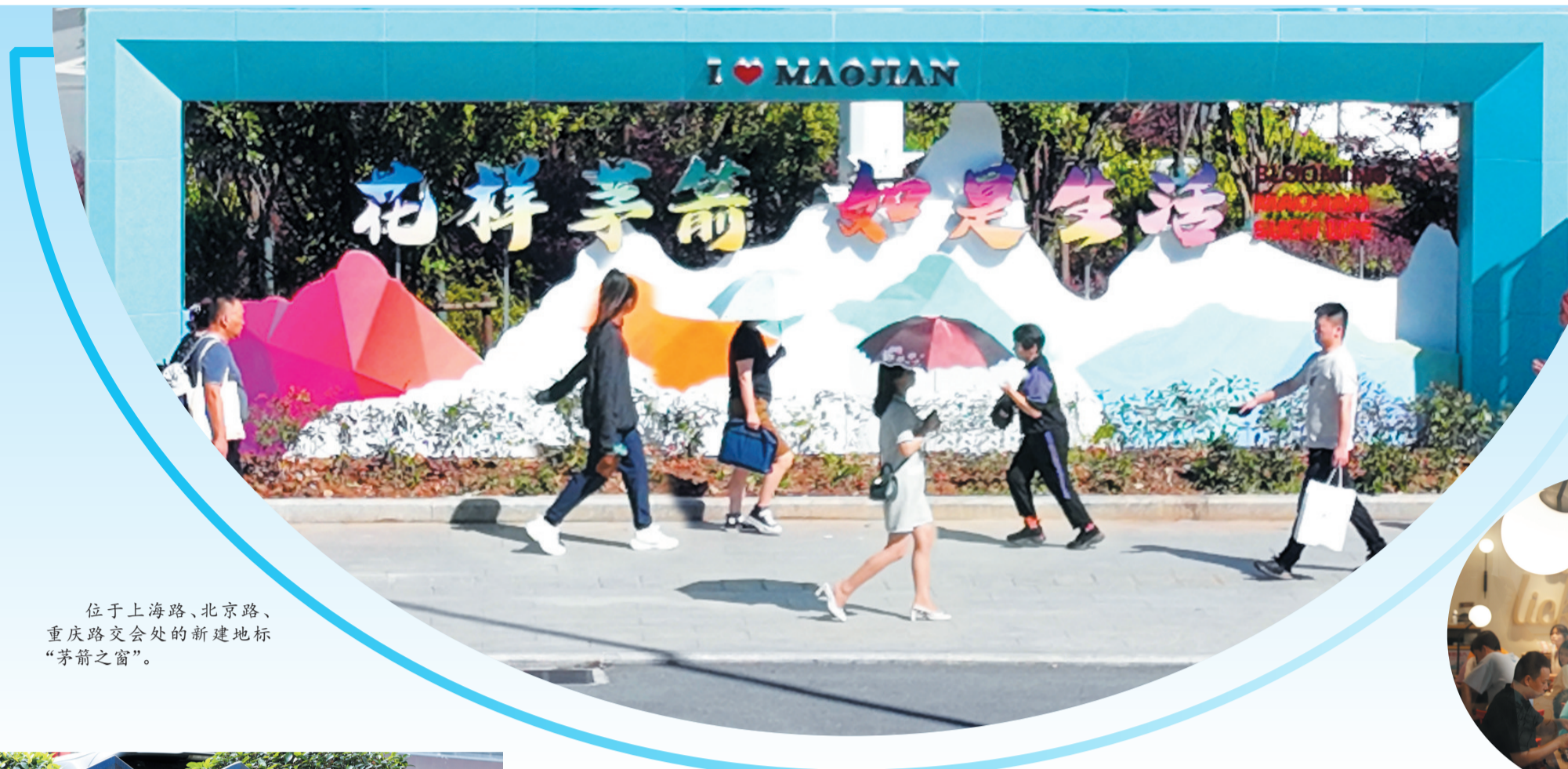
位于上海路、北京路、重庆路交会处的新建地标“茅箭之窗”。