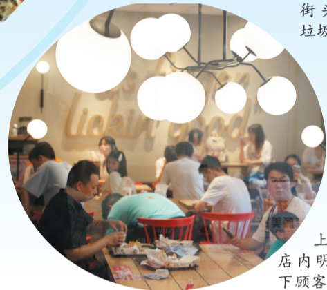
上海路餐饮店内明亮的灯光下顾客满座。