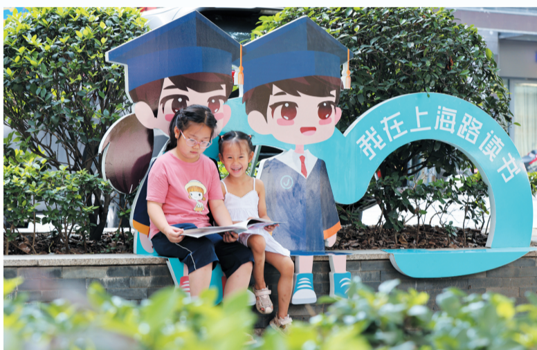
上海路人行道新打造的“我在上海路看书”景观点。