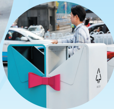
上海路街头的新型垃圾桶。