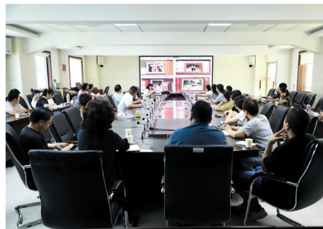
市中心血站廉政主题辅导讲座现场

源。据悉，该院坚持用好警示教育基地，全方位、多角度展示郧阳检察平安建设、法治建设和清廉建设成果；做实清廉文化建设，将检察文化与清廉文化有机融合，营造浓厚的清廉文化氛围；大力宣传清廉榜样先进事迹，弘扬时代正气，展现时代风采，激励干警忠诚履职、干事创业。（通讯员周丽霞 陈明亮）