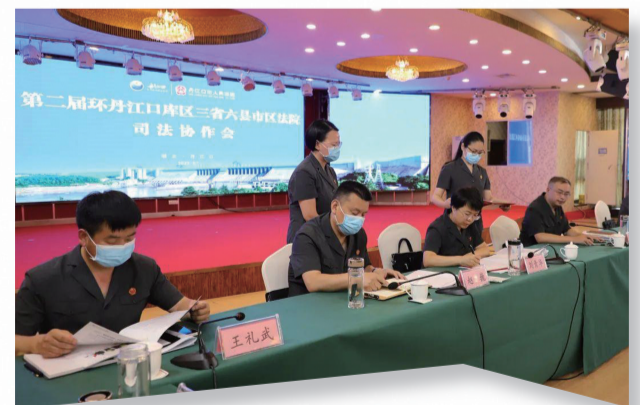
丹江口库区三省六县市区法院司法协作会

加强跨区域协同，推动形成流域综合治理多元格局。2020年6月，郧西县、丹江口市、郧阳区人民法院与陕西省商洛市洛南县、商州区和河南省南阳市淅川县人民法院建立协作联动机制，共筑南水北调水源地生态环境资源保护“司法屏障”。2021年4月，在最高人民法院的指导推动下，湖北、河南、陕西三省高级人民法院在丹江口市共同签署《关于环丹江口水库生态环境保护与修复环境资源审判协作框架协议》，建立环丹江口水库环境资源审判协作机制。2022年7月，丹江口市人民法院组织召开第二届环丹江口库区三省六县市区法院司法协作会议，会议通过了《关于强化统一环丹江口库区生态环境保护刑事案件裁判尺度的意见》，就非法捕捞水产品罪、盗伐林木罪、滥伐林木罪、破坏国家重点保护植物罪四类常见涉环境资源类刑事犯罪的证据裁判标准和量刑尺度达成共识，使长江流域环丹江口库区内破坏环境资源刑事犯罪裁判尺度相对统一，提升量刑均衡度。十堰市中级人民法院与武汉等地6家法院签署《湖北省汉江流域环境资源审判协作框架协议》，共同服务保障汉江流域的生态环境保护与修复。与武汉海事法院、竹山县人民政府共同签署长江主要支流汉江支流堵河河流域行政执法与司法保护基地共建协议，共建南水北调中线工程水源地生态保护林，将生态环境司法协作保护延伸到长江支流流域，实现“共抓大保护”环境司法服务与保障全覆盖。