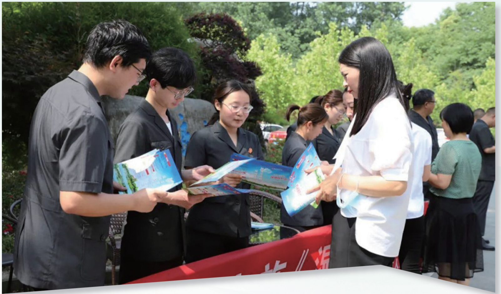
环境司法保护知识科普

为长江流域“十年禁渔”保驾护航，对破坏生态违法犯罪行为果断“亮剑”。近年来，全市法院系统坚持以习近平法治思想、习近平生态文明思想为指导，牢固树立“两山”理念，立足生态优先战略，厚植生态文明底色，自觉把环境资源审判工作融入环境治理体系，深入探索司法参与生态环境社会治理体制机制，以司法之力守护绿水青山，用法赋能高质量发展，为构筑生态屏障、助力我市绿色低碳发展示范区建设提供优质司法服务和强有力司法保障。