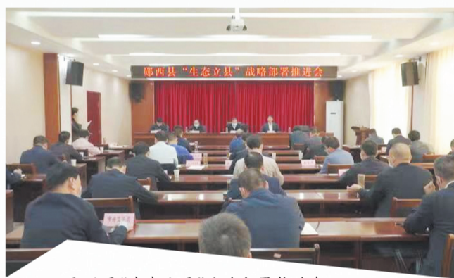
郧西县“生态立县”战略部署推进会