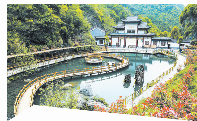
推进生态旅游发展