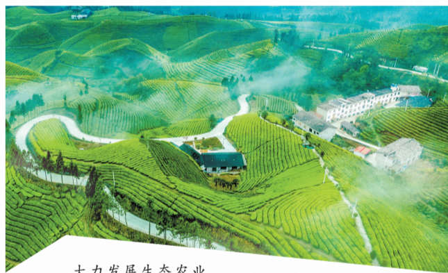
大力发展生态农业