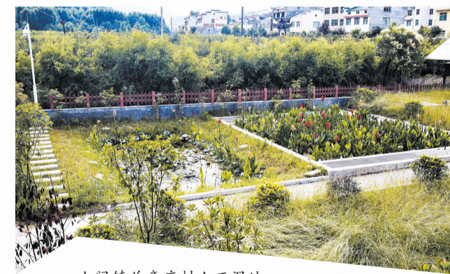
土门镇关帝庙村人工湿地