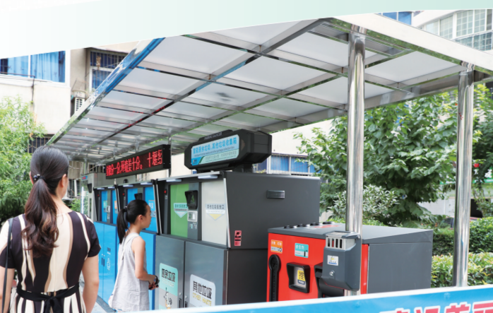
推广垃圾分类,建设美丽家园

聚焦新型工业化,突破性发展绿色产业。编制实施《建设新型工业化示范区实施方案》《突破性发展新能源与智能网联汽车产业三年行动方案》,组建“四个联盟”,建设“四个市场”,实施满园、培育、扩容“三大工程”和“百亿工厂千亿元园区”工程、“十百千万”工程。