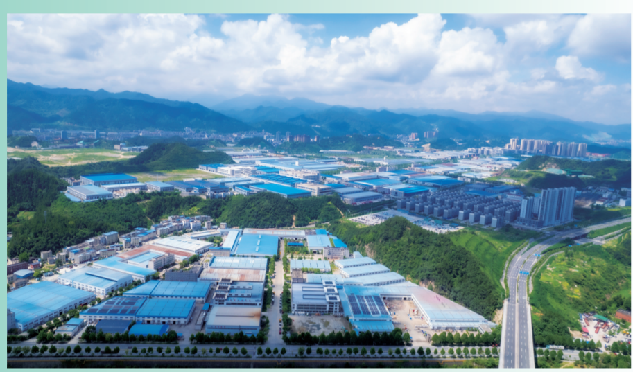
十堰经开区努力打造产城融合示范区