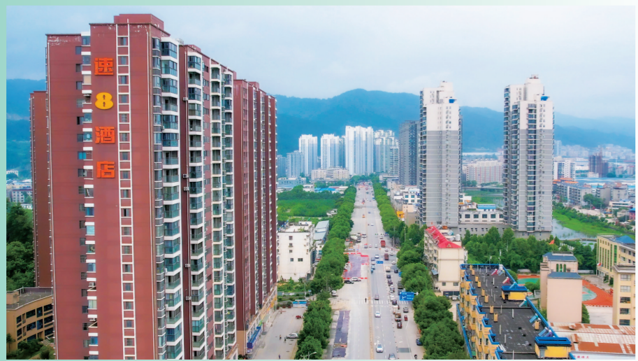
白浪路提升改造项目

坚定不移走生态优先、绿色发展之路,是实现高质量发展的题中之义,也是满足人民群众对美好生活需要的重要路径。近年来,十堰经济技术开发区把生态环保和绿色发展融入经济社会发展的全过程和各领域,聚力攻坚污染防治、着力改善人居环境、大力发展绿色产业,努力实现生态环境质量持续改善与经济社会快速发展双赢的目标。