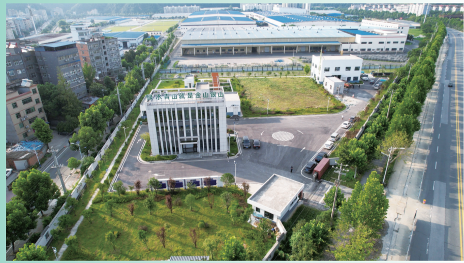
十堰东部综合污水处理厂