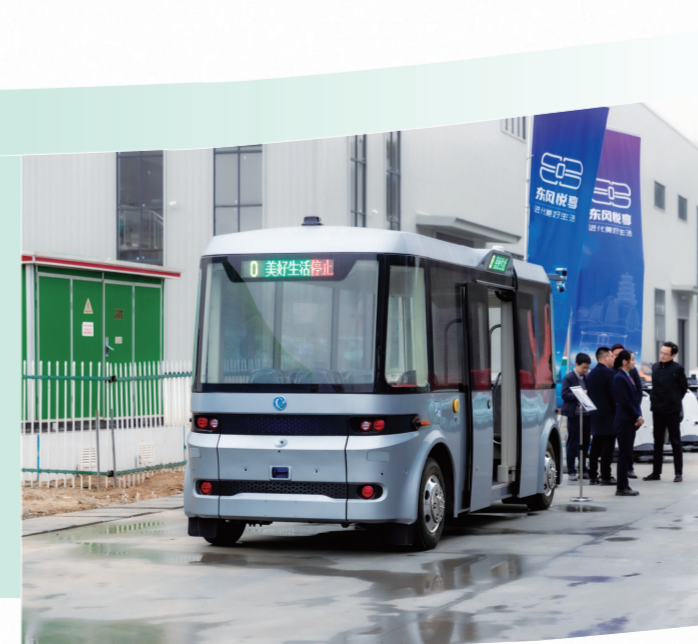
“十堰造”无人驾驶公交车