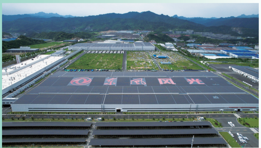
东风小康光伏电站项目