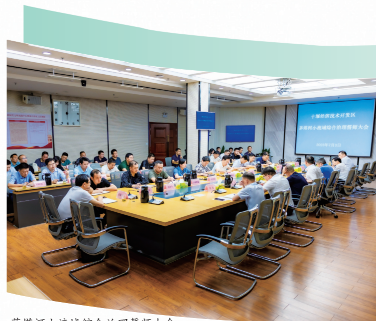
茅塔河小流域综合治理专家大会

越来越干净整洁的人居环境,让十堰经济技术开发区广大群众真切享受到生态红利,迎来更方便、更舒心、更美好的生活。