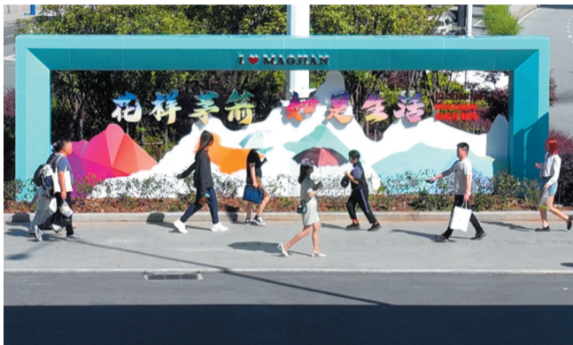
茅箭之窗 记者刘昱 摄

十堰心，即茅箭区有“一箭五心”的资源禀赋，五心是政治中心、文化(体育)中心、商业(经济)中心、教育中心和医疗中心(三甲医院集聚地)；武当境，即茅箭区境内赛武当风景