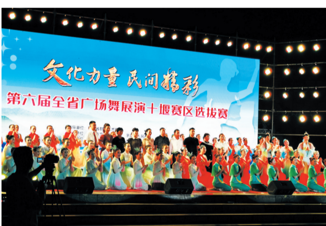
全省第六届广场舞展演十堰赛区选拔赛

色旅游产业升级，大力发展精品红色文化旅游、红色品质旅游，培育符合茅箭红色旅游产业未来发展需求的高品质、高星级的A级旅游景区，全力推动东沟景区创4A级景区提档升级工作。目前，东沟景区正积极准备景观价值评定报告，力争进入全省创4A级景区第一梯队。同时，围绕打造国家工业旅游示范基地，多次与东风公司对接，正积极申报创建国家工业旅游示范基地。