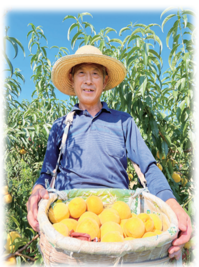
果农采摘“锦绣黄桃”

“这黄桃口感非常好，我准备买100份发给职工们尝尝。”“汁多、肉甜，很好吃。”“我也带一些回去，让家人们一起品尝。”……连日来，在