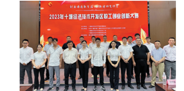
举办职工职业技能大赛。

建立“竞赛+创新”模式。紧扣推进传统制造业转型升级,在重点企业开展比武等多工种特色竞赛。截至目前,举办区级职业技能竞赛20多场次,涵盖10多个工种,评选出200多名“技能状元”“技术能手”;举办企业技能竞赛上百场,涉及工种突破50个,参赛职工万余人次。