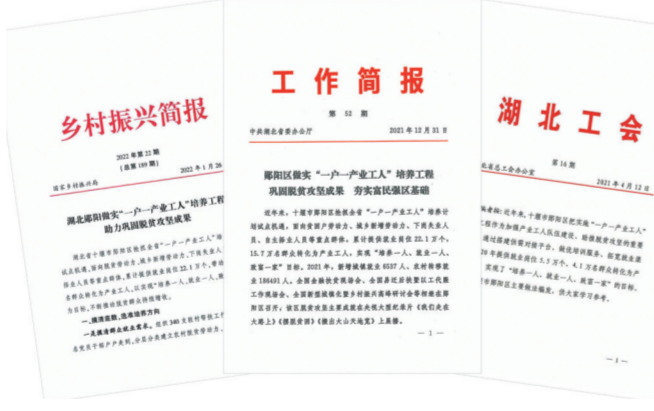
郧阳区“一户一产业工人”培养工程做法宣传推介。

打造阵地,固本培元。持续整合资源,壮大“一户一产业工人”培训师队伍。授予大运汽车、棉纺棉伴、长江医药、万润新能源等16家企业“一户一产业工人”培训基地称号,以点带面、示范引领,促使“一户一产业工人”遍地开花。