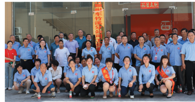
万顺叫车竹溪分公司工会成立。

县总工会划转200平方米房屋打造新就业形态“职工之家”,实现10个新业态新就业形态行业联合会集中办公,统一领导,分工负责,各司其职。开展新就业形态行业企业“六有”工会、“六有”职工之家达标和示范创建,坚持每年示范创建3家、达标创建5家,3年实现全覆盖,打造各行业工会示范样板。