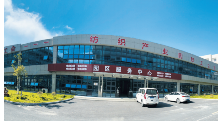
纺织产业园区职工之家。

党建强家,让职工心系大家。党建带工建、工建服务党建,广泛开展园区企业建会、会员发展工作,激励广大职工干事创业、奋勇争先,使基层工会真正运转起来、活起来。