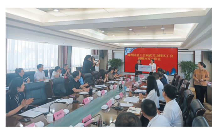
北京通州区总工会向武当山特区工会捐赠190万元资金。

同时,武当山特区工会积极对接北京通州区总工会,签订对口工作协议,争取援助资金190万元;通州区总工会的劳模疗休养基地在武当山挂牌;出台对通州区工会会员到武当山疗休养的优惠政策。截至目前,通州区总工会共组织劳模、职工来武当山疗休养11批260人。