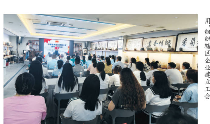
茅箭区总工会发挥社区工会作用,组织辖区企业建会。

激活“细胞”,着力打造基层工会。区总工会完善“小三级”工会职责,探索出“三建三管三服务”路径,切实发挥“小三级”工会作用,激发“小三级”工会活力,为茅箭高质量发展贡献工会力量。