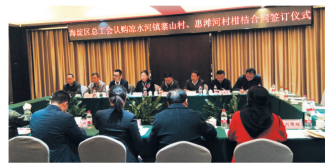
北京海淀区总工会代表团(左)与丹江口市总工会代表团(右)在丹江口市总工会签订合作协议。

围绕发展大局开展系列对口协作活动。海淀区总工会先后支持建设丹江口市职工服务中心等项目,连续5年在丹江口市购买武当蜜桔价值380余万元,采购其它农产品价值800余万元,捐赠防疫物品价值10万元,协作开展工会干部培训7批38人次,开展农民工实用技能培训10期500余人,联合建设劳模(职工)疗休养基地4家,帮助建设的金蝉孵化养殖项目实现每亩园年增收2000元,有力支持丹江口市精准扶贫及乡村振兴。如今,海淀区总工会成为北京海淀区直部门对口协作工作排头兵。