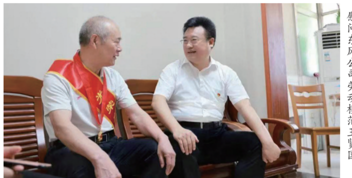
市委常委、张湾区委书记张涛(右)在张湾区总工会与企业负责人交流。

坚持改革引领,矢志不渝谋发展。大力弘扬“三个精神”,表彰各类先进典型370个。出台《张湾区技能大师奖励政策(试行)》。实施创新驱动发展战略,培育省、市劳模(工匠)创新工作室20家。成立全市首家劳模(工匠)创新工作室联盟,全国首届十大创新工匠创客入驻工作室。