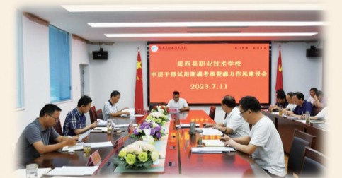
郧西职校召开中层干部试用期期满考核暨能力作风建设会

同时,该校结合县域产业发展情况,积极面向社会开展汽车驾驶、电子商务、蔬菜加工、小提琴生产、桃园管理、幼儿保育等技能培训,先后培养乡村振兴带头人500余人和各类专业技术人才万余人,带动产业发展,帮助万余个家庭走上致富路。