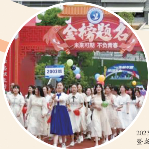
郧西职校 2023届毕业典礼 暨成人礼仪式