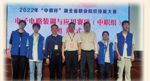
郧西职校在全省职业院校技能大赛中获佳绩