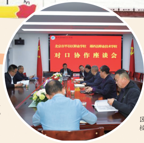
北京市平谷 区职校到郧西职 校开展对口协作