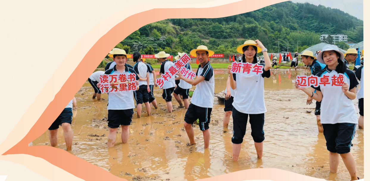
郧阳中学学生参加农耕实践活动。

肩鸿任钜踏歌行，百年郧中展宏图。每一位郧中人，每一个郧中故事，如一盏盏明灯，传承薪火，照亮了一代代郧中学子“居者善六邑之俗，出则光四国之仪乎”的人生梦想。