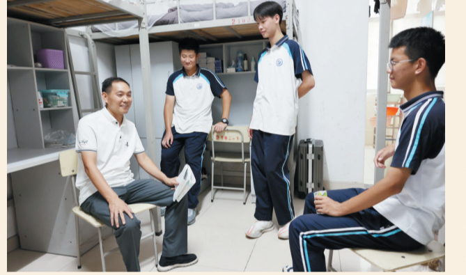
屈光耀老师与学生谈心。