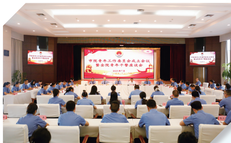
2023年7月21日，市人民检察院成立青年工作委员会。