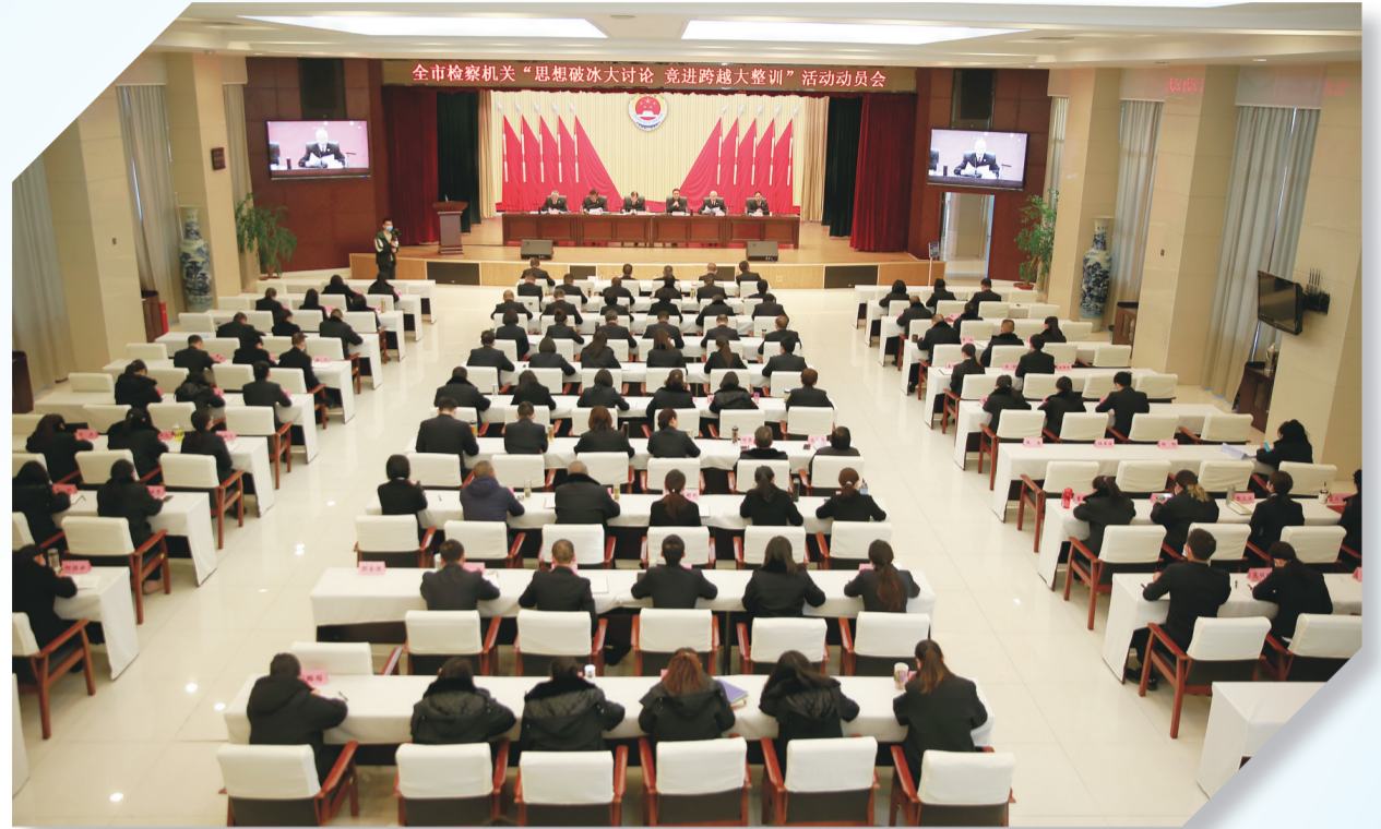
2023年1月30日，十堰检察机关召开“思想破冰大讨论 竞进跨越大整训”活动动员部署会。

唯创新者进，唯创新者强，唯创新者胜。近年来，市人民检察院在省人民检察院和市委的坚强领导下，紧紧围绕服务保障湖北加快建设全国构建新发展格局先行区、十堰建设绿色低碳发展示范区工作大局，锚定创一流、争第一、干唯一目标，抢抓新发展机遇，聚焦检察办案、机制创新、品牌塑造、队伍建设，砥砺奋进，攻坚克难，以新理念、新思路、新举措，推动新时代检察工作再上新台阶。