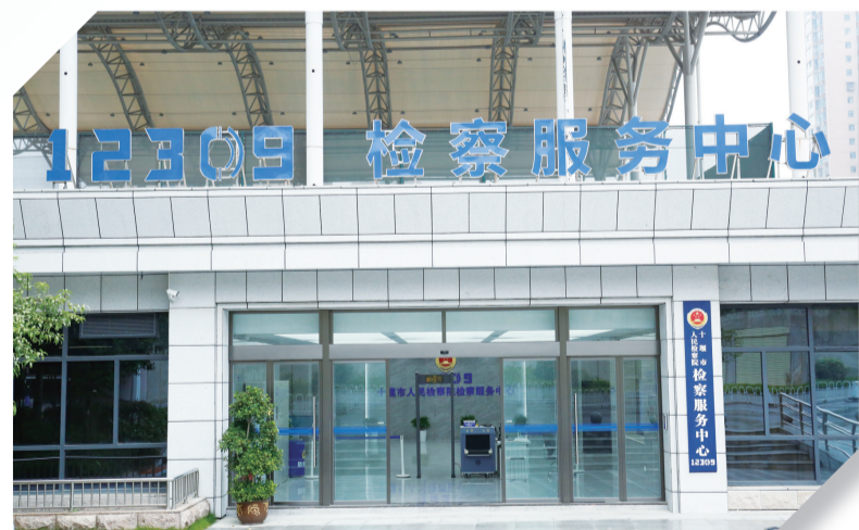
市人民检察院升级改造后的12309检察服务中心。