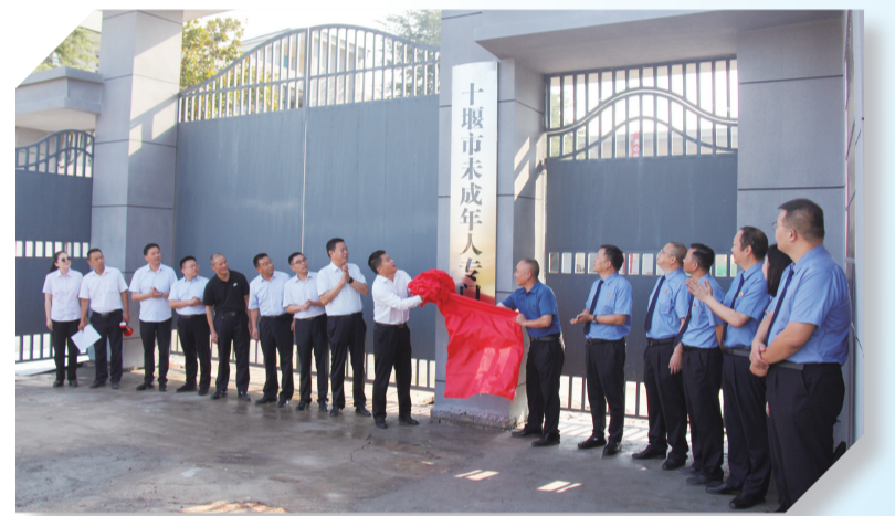
2023年8月31日，在全省率先探索筹建的公益、公办性质的教育管理罪错未成年人专门学校——十堰市未成年人专门学校揭牌。

服务保障绿色低碳发展，法治护航同步。为筑牢南水北调中线工程核心水源地生态屏障，十堰检察机关创新推动丹江口市人民检察院建设十堰市“两山”理论检察实践基地。该基地由生态检察数字办案中心、法治化宣导中心、专家工作室等功能区构成，涵盖习近平生态文明思想内容展示、检察机关“两山”理论探索创新、典型案例等内容，既是展示全市生态环境保护检察职能的“新名片”，也是十堰检察机关依法保护生态环境的“新战场”。