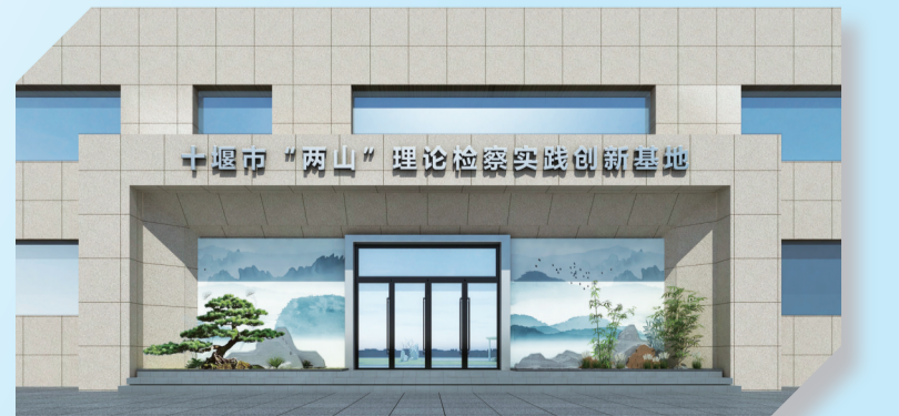
市“两山”理论检察实践创新基地效果图。

踔厉奋发再启程，笃行不怠建新功。成绩是奋斗的起点，站在新起点，十堰检察机关将牢记使命、锐意进取，以创新为动力，不断激发检察工作新活力，以更优检察履职、更实工作作风、更好法治环境书写检察事业高质量发展新篇章。